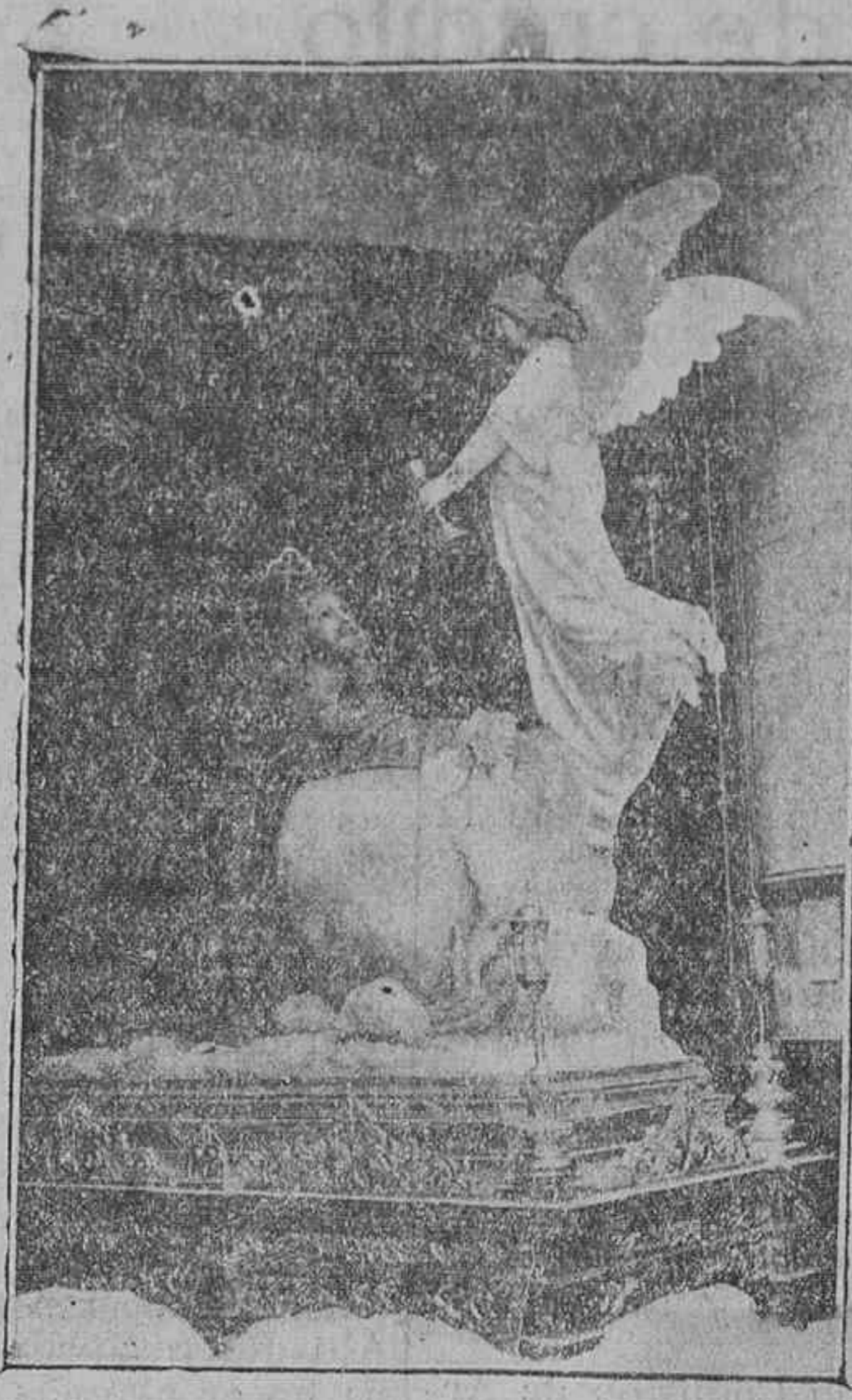
LA ORACION DEL HUERTO

(Paso que se estrenará en la Procesión de mañana, viernes).