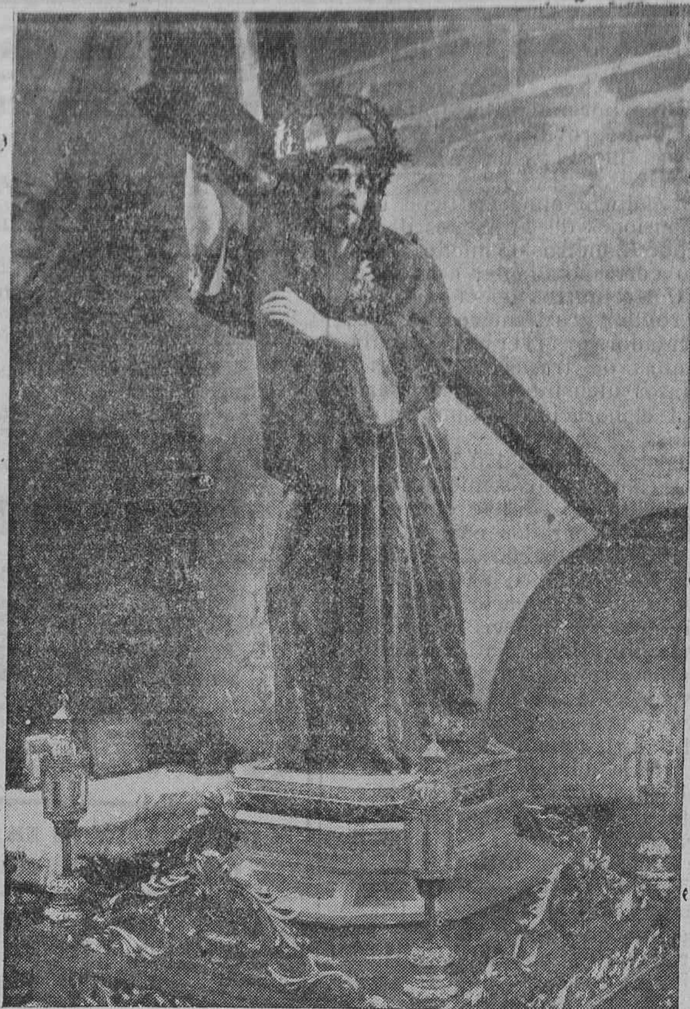
JESUS CON LA CRUZ A CUESTAS