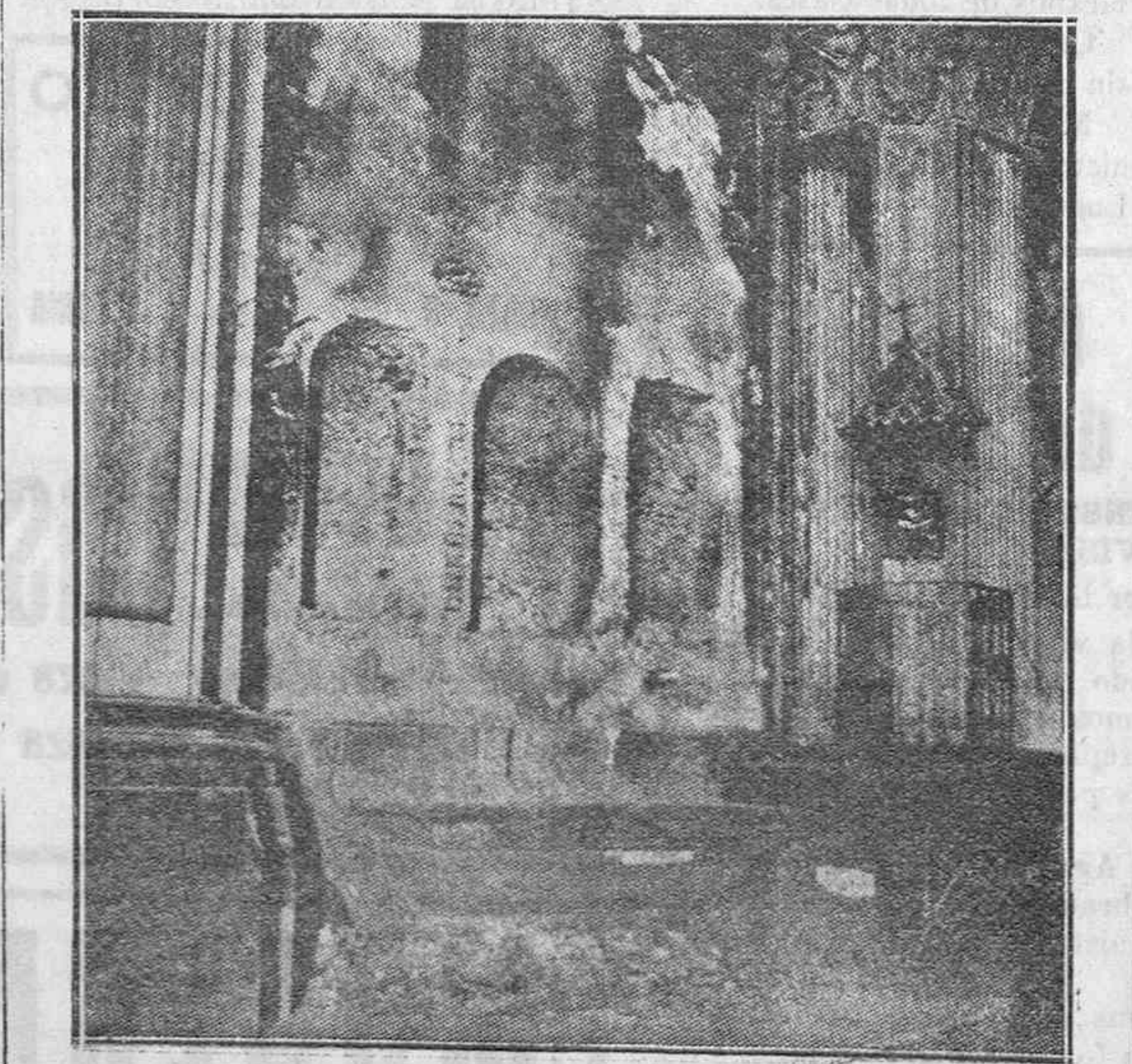
Puente Genil (Córdoba).—Restos de un altar de la Parroquia de Sta. María Magdalena, saqueada e incendiada por los rojos.