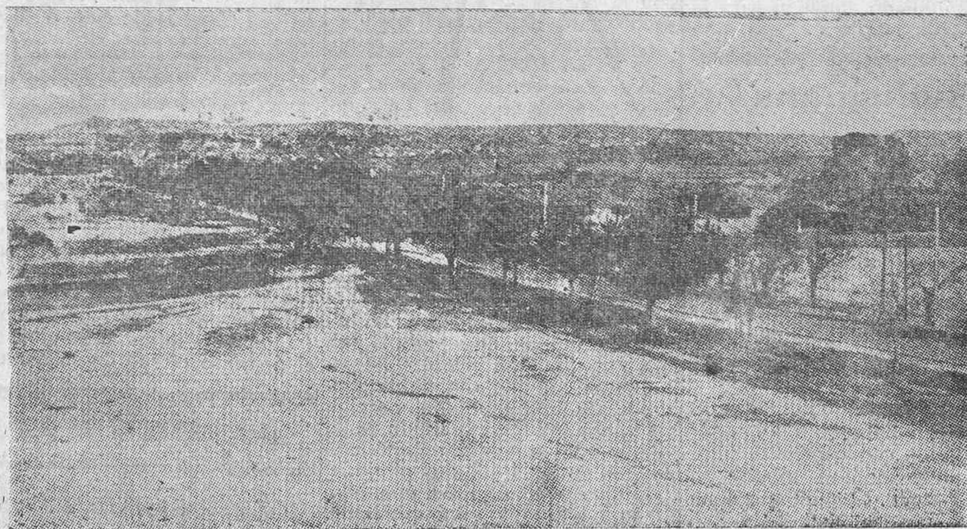
Cerca de tres mil muertos dejaron el sábado los rojos en esta magnífica explanada entre Carabanchel y Casa de Campo

Barcelona.—Una gran multitud de extremistas intentó ayer entrar a viva fuerza en la Generalidad. Los guardias intentaron oponerse e hicieron uso de las armas pero se les contestó en la misma forma. La fuerza pública tuvo que hacer uso de las ametralladoras desde el interior del palacio e incluso tuvieron que ir algunos aviones a bombardear a los manifestantes.