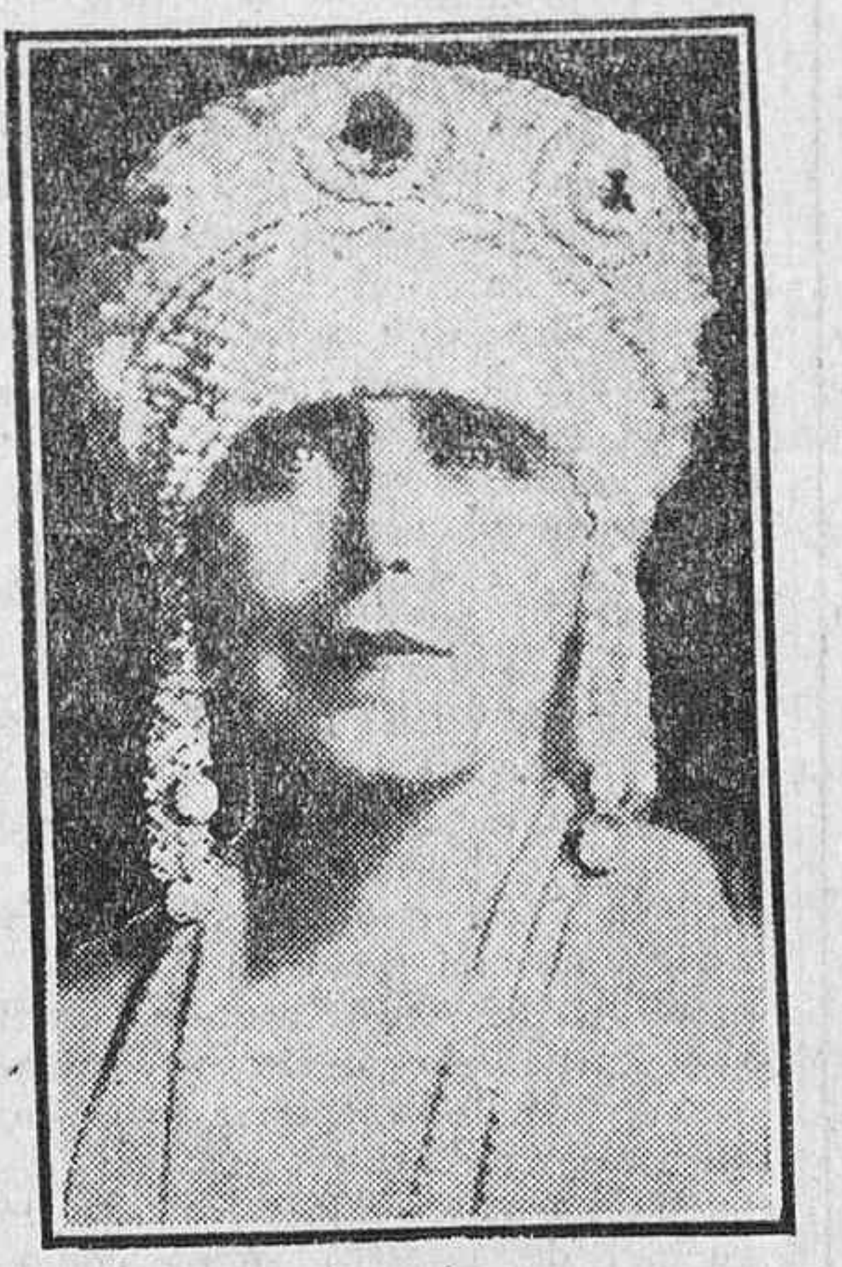
Ultima fotografia de la reina viuda de Rumania, que actualmente está enferma en su residencia de Copacani.