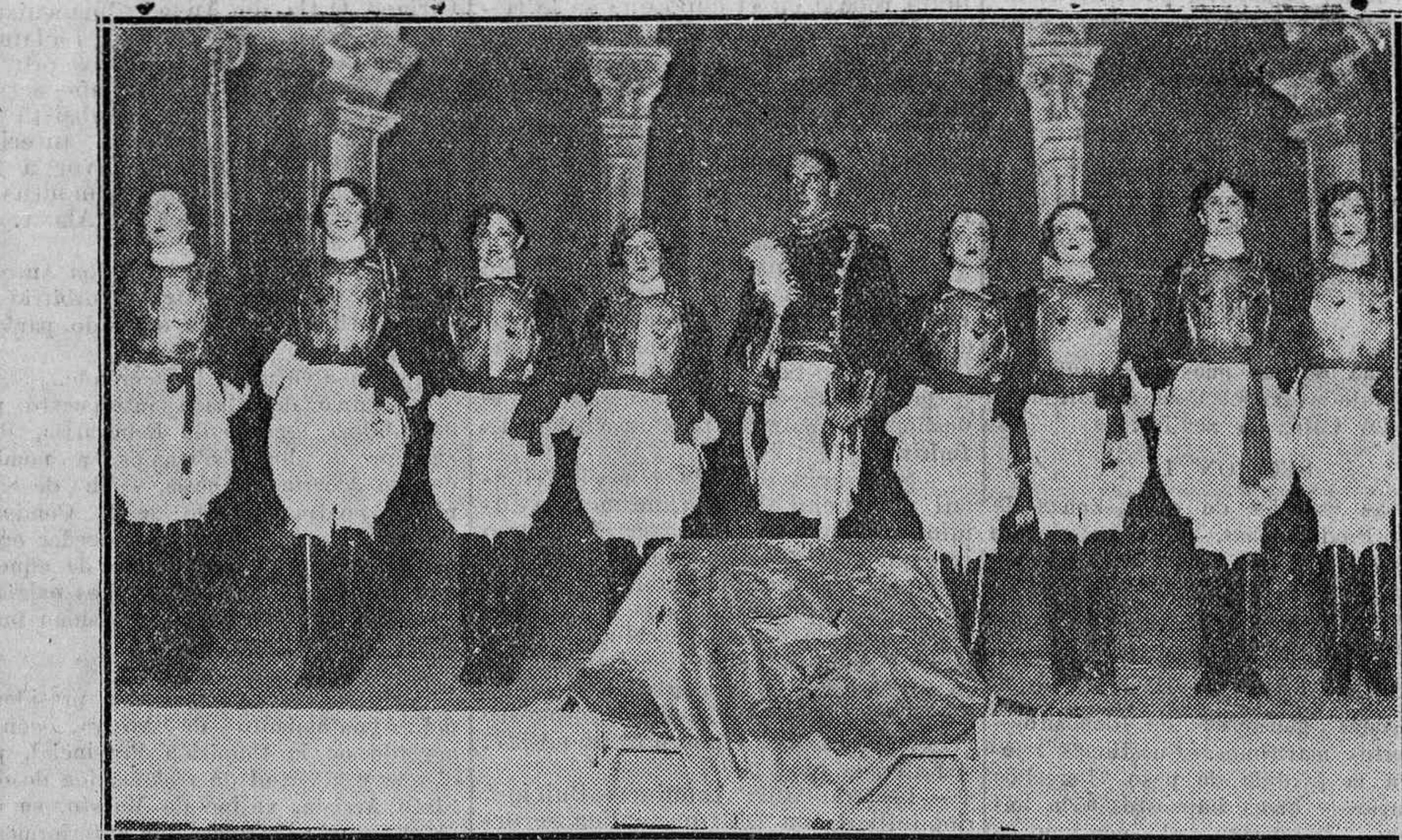
La comisión que entiende en los preparativos de la velada que ha de celebrarse, Dios mediante, en la noche del miércoles, víspera de la Ascensión del Señor, ha ultimado ya el programa que, como se verá, no puede encerrar mayores atractivos.