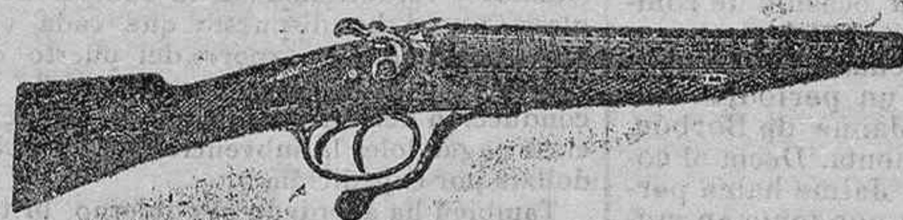
Modelo de escopeta de fuego central dos cañones 6 pesetas 45 y 50