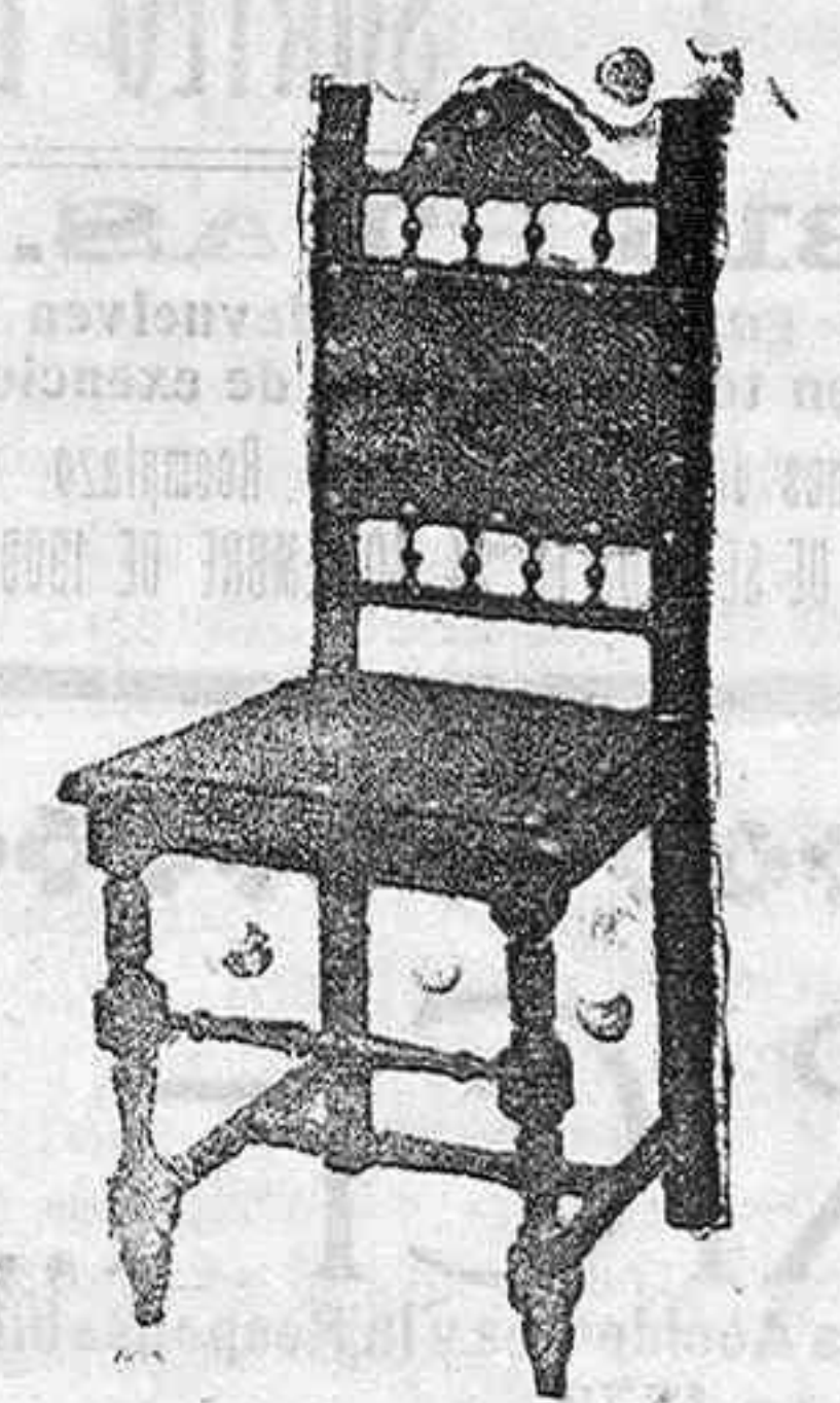
Núm. 116—SILLA color nogal de mucha aceptación por su solidez á pts. 4'25

Miraguano superior para almohadas y edredones traído directamente de una casa recolectora, el kilogramo á Pesetas 2'20