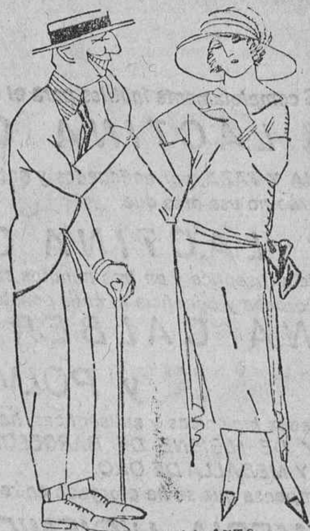
ELLA.—Dice mi padre que no nos podemos casar porque no tienes con qué comer. EL.—Dile a tu padre que doblo una perra gorda con los diez tes.

En días sucesivos continuará reuniéndose la Diputación para despa char diversos asuntos que se hallan pendientes de resolución.