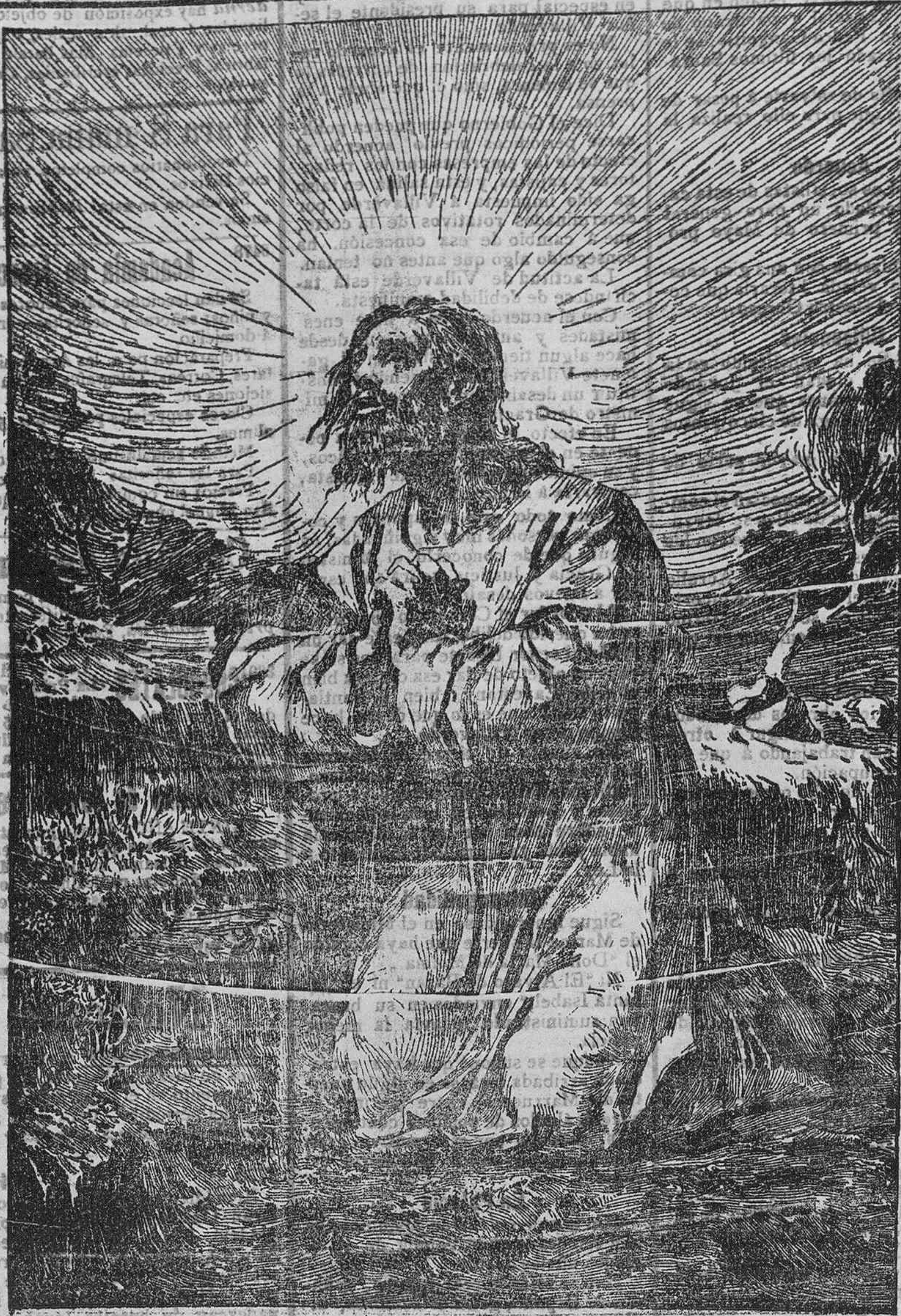
LA ORACIÓN DEL HUERTO (Cuadro de Bildebrand)