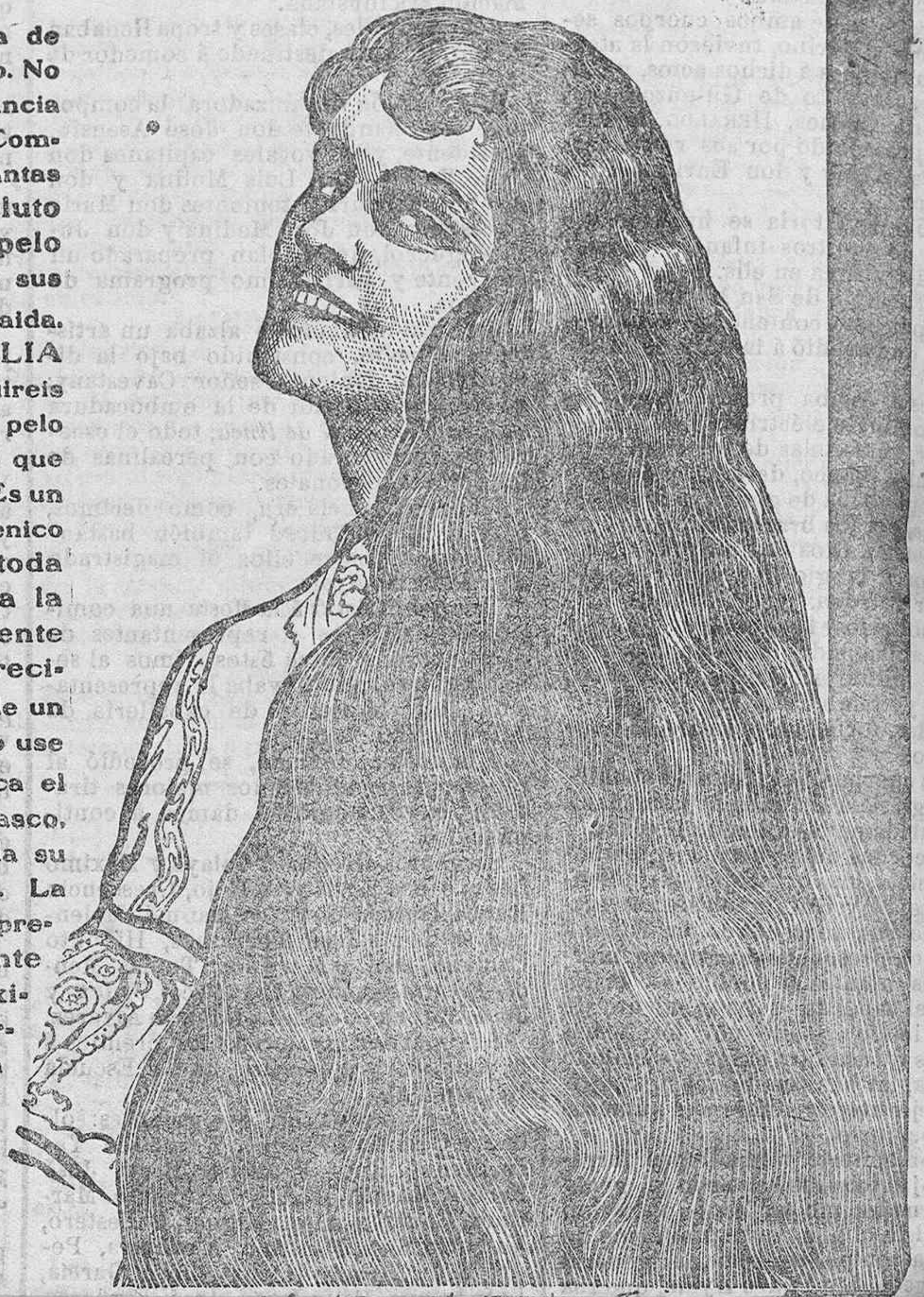
Ch. Itroquet - Lunay, France

Es la preparación mas sana de Tocado para fortalecer el pelo. No contiene ningún toxico ni sustancia química que pueda dañarlo. Compuesta exclusivamente de plantas aromáticas, impide en absoluto que el germen ataque al pelo y por lo tanto que destruya sus raíces, causa principal de la caída. Si usais la LOCION VITTELLIA a diario no solamente conseguireis una cabeza limpia, sino de pelo rico y abundante, sin temor a que jamás se debilite ni se caiga. Es un tónico tan excelente e higiénico que preserva el pelo de toda clase de impurezas, quita la caspa y vigoriza fuertemente las raíces, promueve su crecimiento y puede asegurarse de un modo terminante que quien lo use a diario en la forma que indica el prospecto que acompaña al frasco, conseguirá tener durante toda su vida una radiante cabellera. La LOCION VITTELLIA, es preparación de tocador puramente vegetal e inofensiva, de exitos maravillosos, de perfume delicado, que nunca debe faltar en las familias y en la Toilette diaria. La LOCION VITTELLIA, es para el pelo lo que el sol para las plantas.