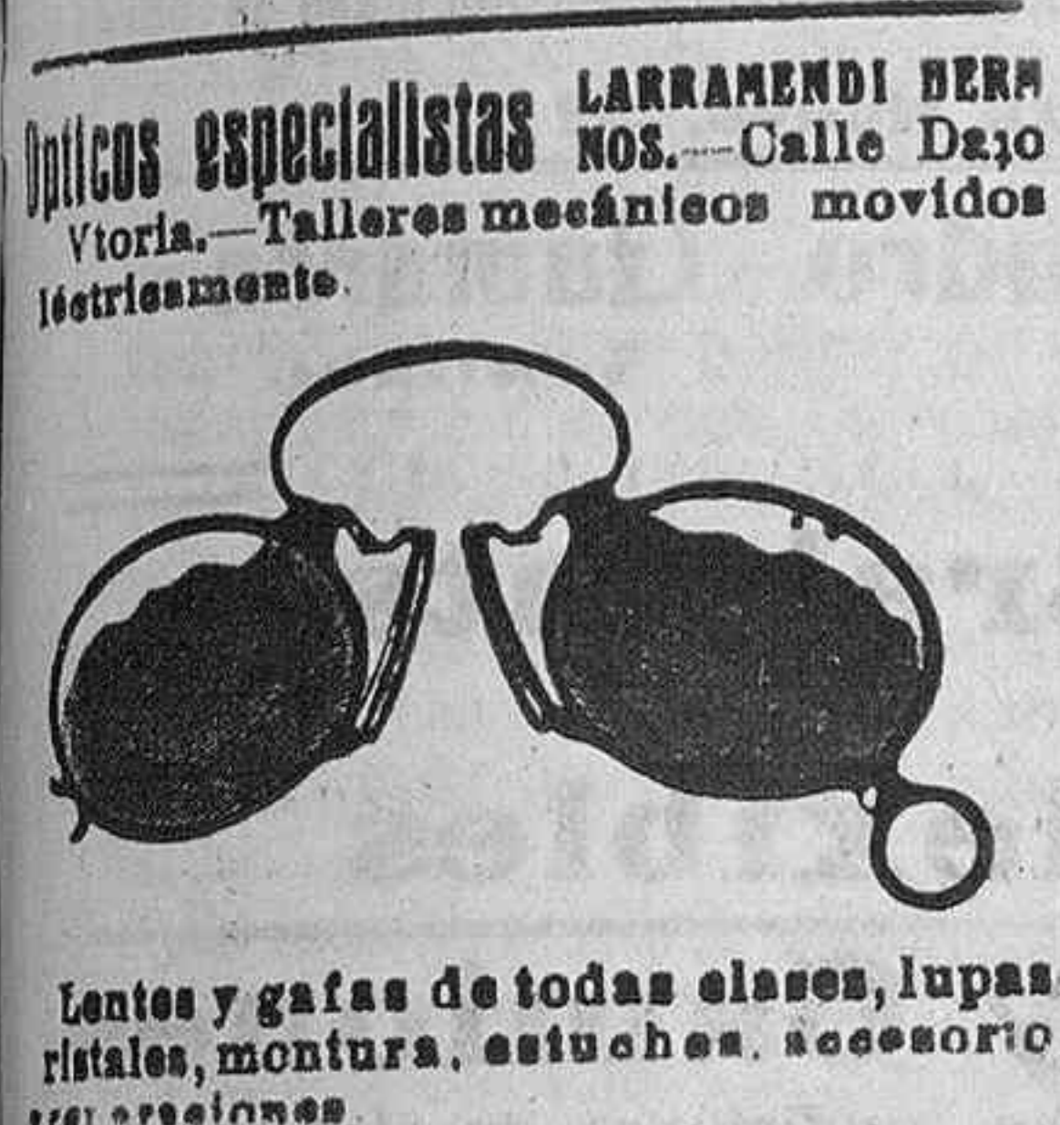
Lentes y gafas de todas clases, lupas, cristales, montura, estuches, accesorios y reparaciones.

Opticos especialistas LARRAMENDI BERNARDOS. Calle Dato 3 Vitoria. Talleres mecánicos movidos y electricidad.