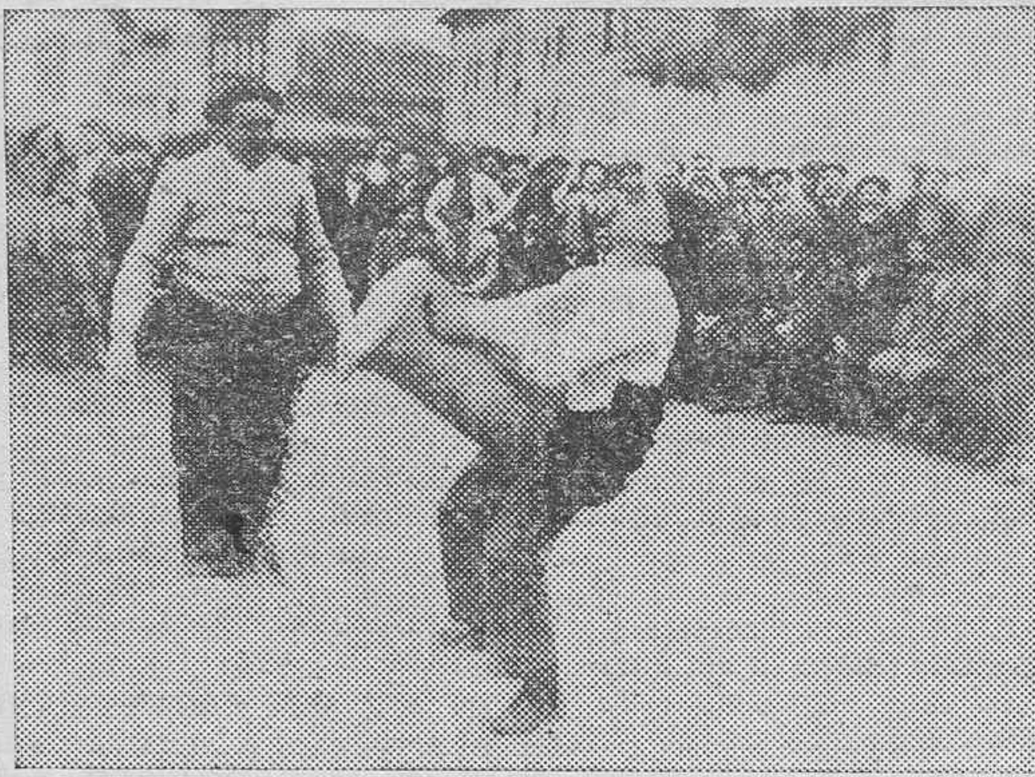
DEPORTES VASCOS.—Ejercicios de levantamiento de pesos.