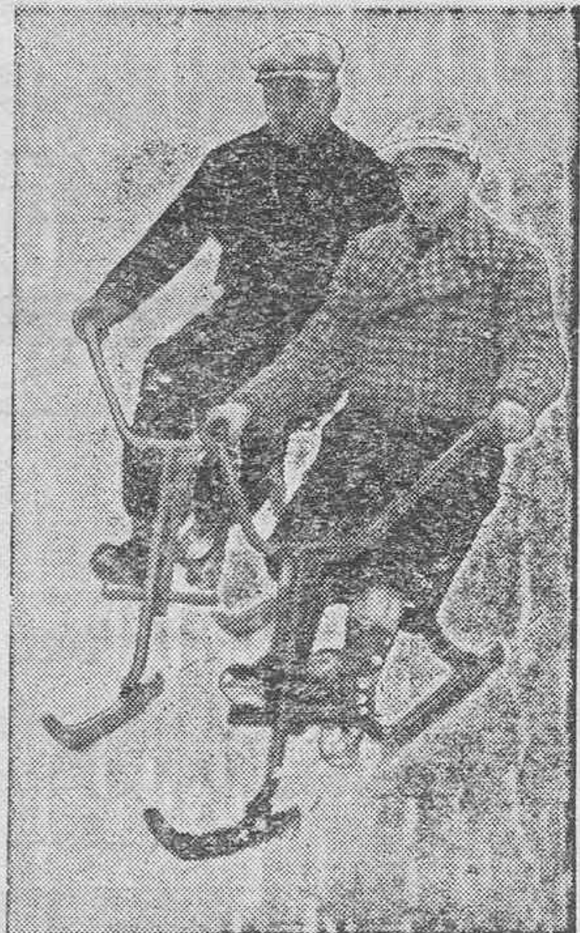
El trineo bicicleta, con un solo chillo, que es la última novedad en los deportes de la nieve.