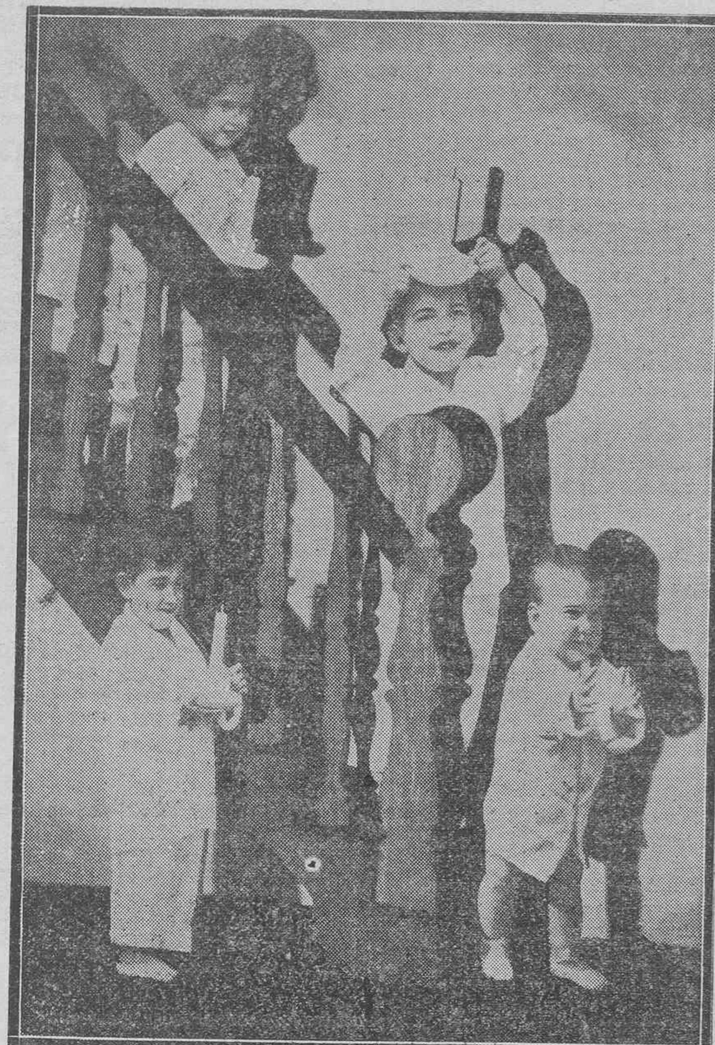
Está amaneciendo. Los chiquitines han pasado una noche de intranquilidad. Sin resistir ya la quietud de la cama, hacen esta travesura de echarse escaleras abajo a ver si los Reyes llegaron, dejando el grato recuerdo de los juguetes.