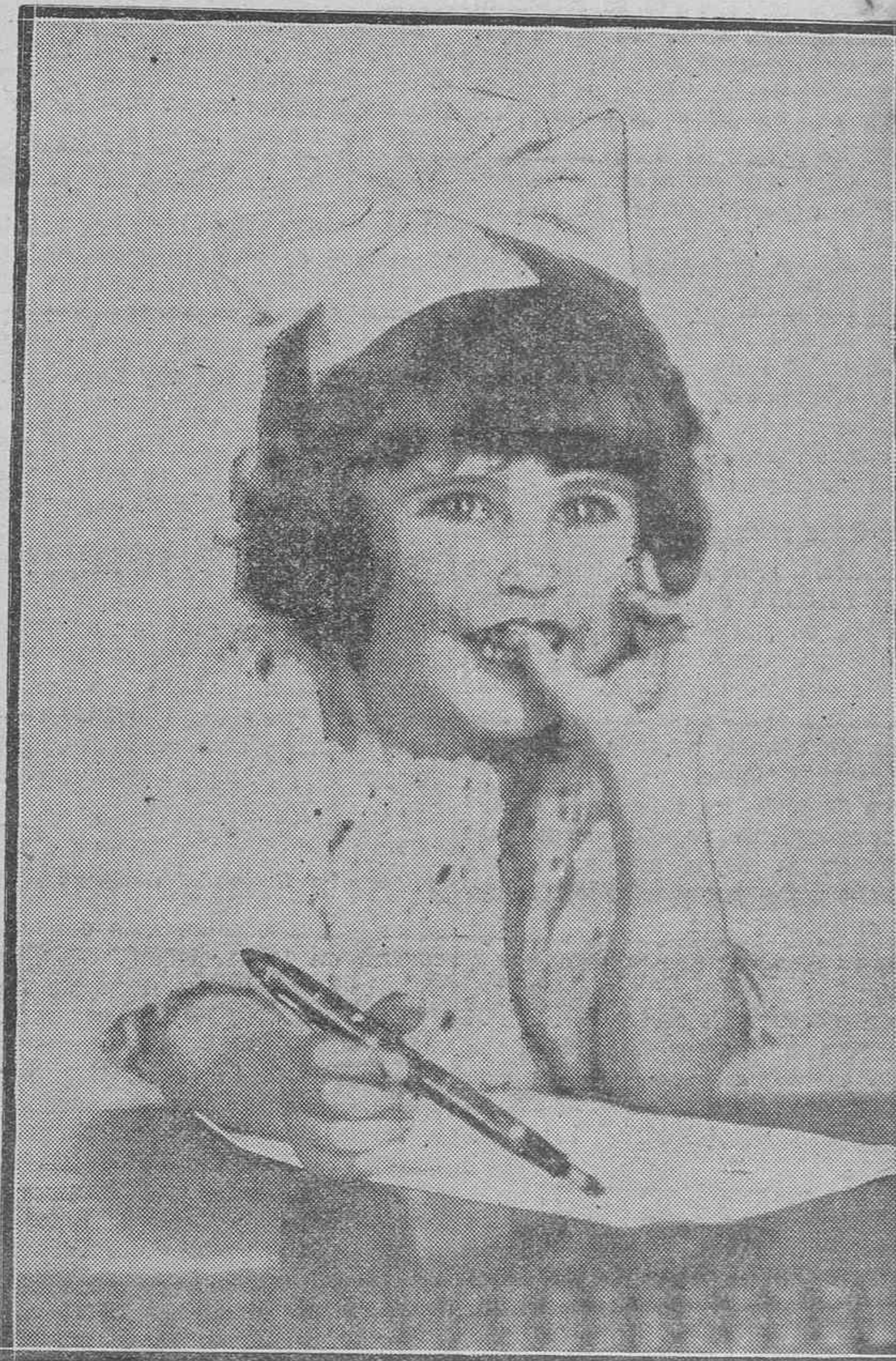
La pequeñuela le ha pedido a papá la pluma estilográfica y escribe su cartita a los Reyes Magos: “Quiero que me envíen una muñeca y...” Después del “y” pongan ustedes todo lo que quieran, porque la nena está dispuesta a recibirlo con alborozo..

Baltasar.—Lo tendrás. Aunque nacido negro tengo un corazón como de aquí a Zaragoza. Amo a los niños, porque soy un monarca sin sucesión: la negra de mi mujer no me ha dado familia. Cuando yo me muera—y no tardará, porque estoy viejísimo—mi tronco será del primer negro que llegue y lo ocupen. Bien querria nombrarte mi heredero, pero el orden dinástico de mi país