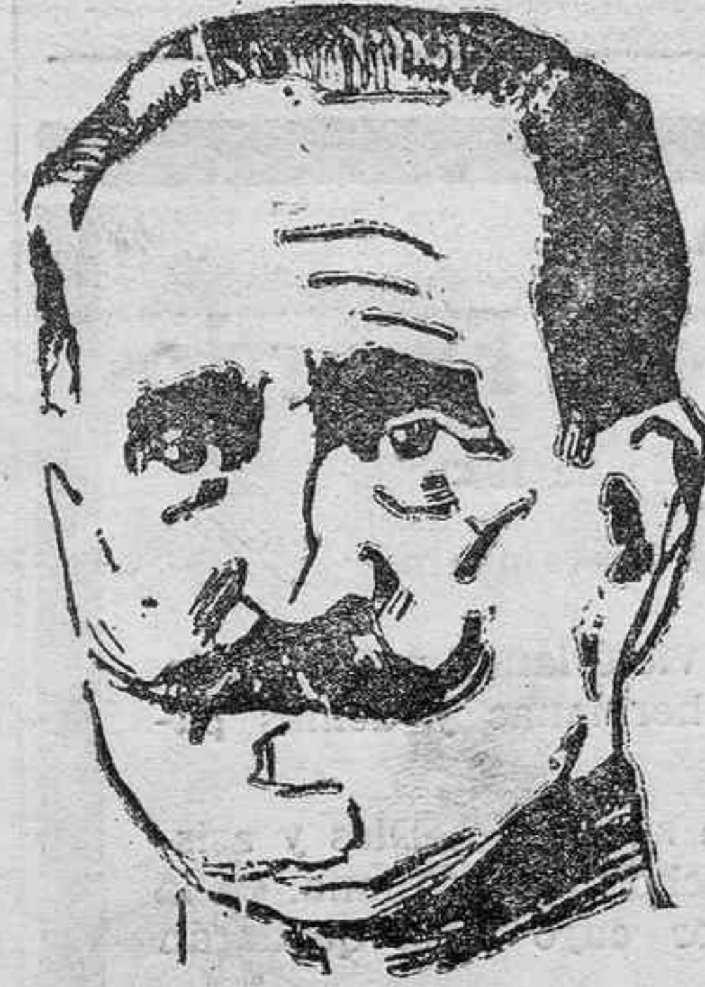
El general Fernández Pérez, para el que se pide la pena de muerte