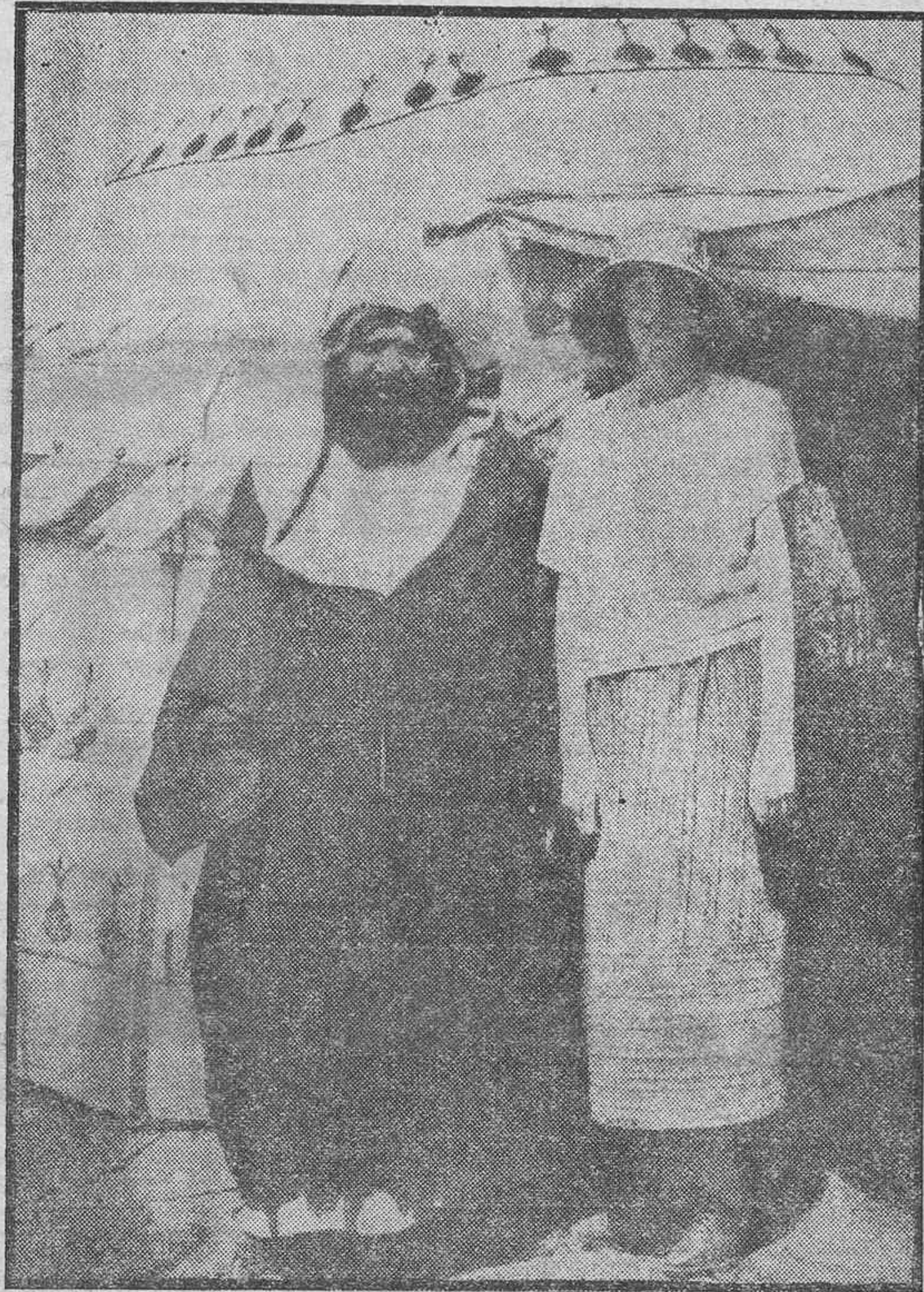
El famoso cherif, El Raisuni, acompañado de la intrépida exploradora inglesa, Rosita Forbes, que hace poco le visitó en su residencia de Tazarut, donde ha sido hecho prisionero por Abd-el-Krim.

Por los telegramas que el domingo publicamos se habrán enterado nuestros lectores de los interesantes detalles que se han recibido de Marruecos sobre la captura del Raisuni, hoy en poder de Abd-el-Krim.