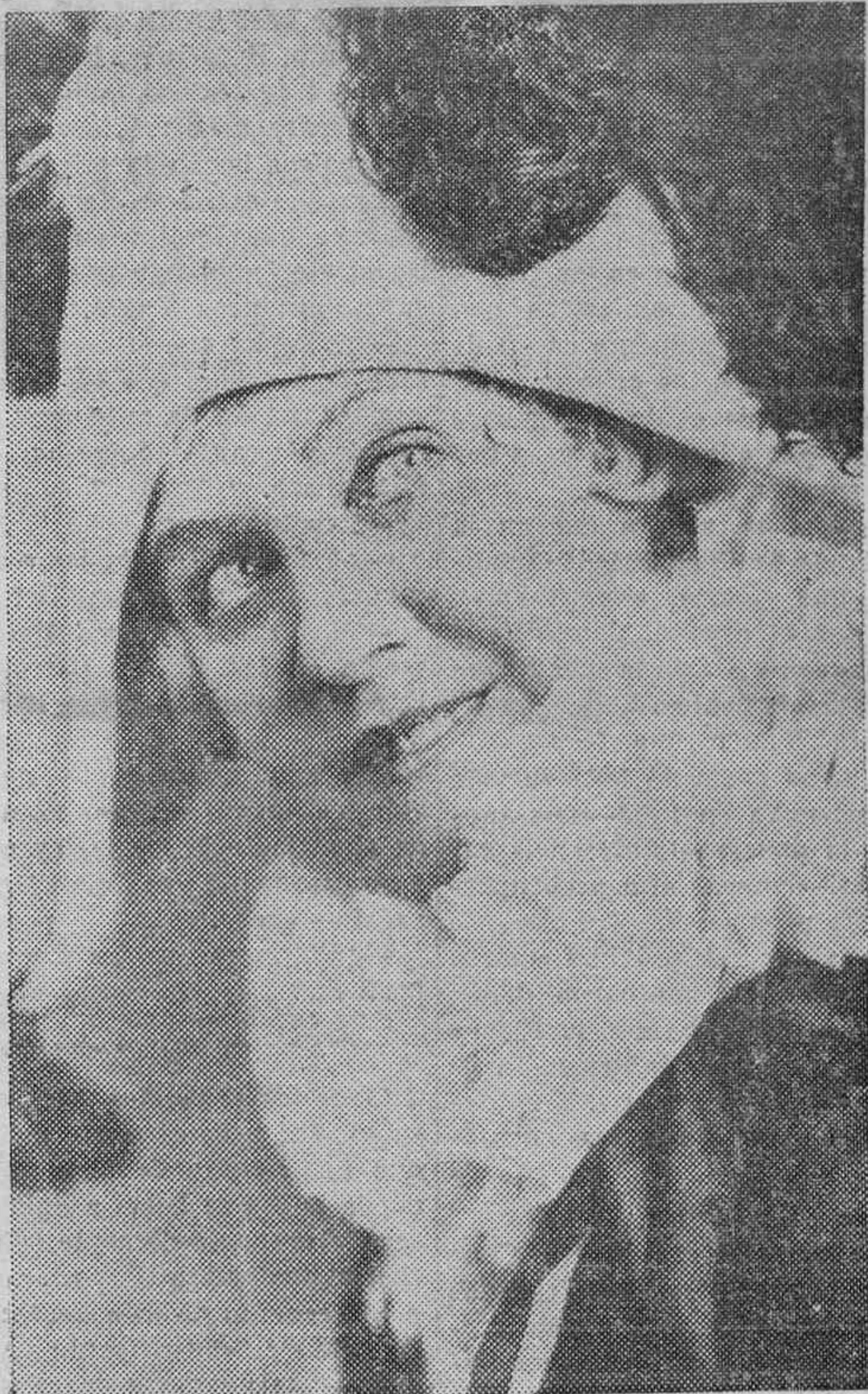
MARTHA ATTUVO, CANTANTE DE OPERA

En Londres la multitud, que se había agolpado en los diques y los puentes del Támesis para ver pasar el avión, sufrió una desilusión.