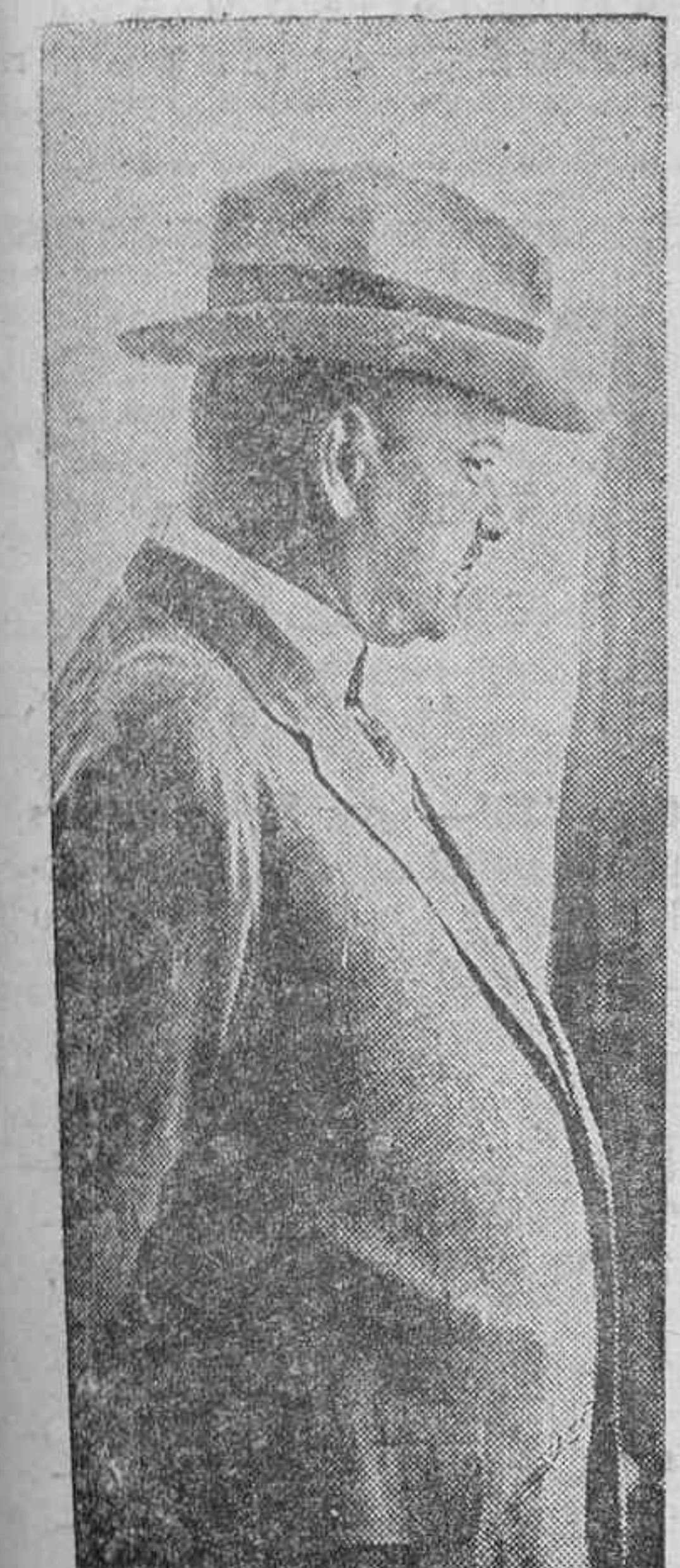
El Dr. Siresemann, que según los telegramas parece seguirá desempeñando la cartera de Estado en el nuevo Gobierno de coalición que trata de formarse en Alemania.

Consultas: De 11 a 12 de la mañana, y de 3 a 5 de la tarde. Calle de Alfonso XIII, número 32.