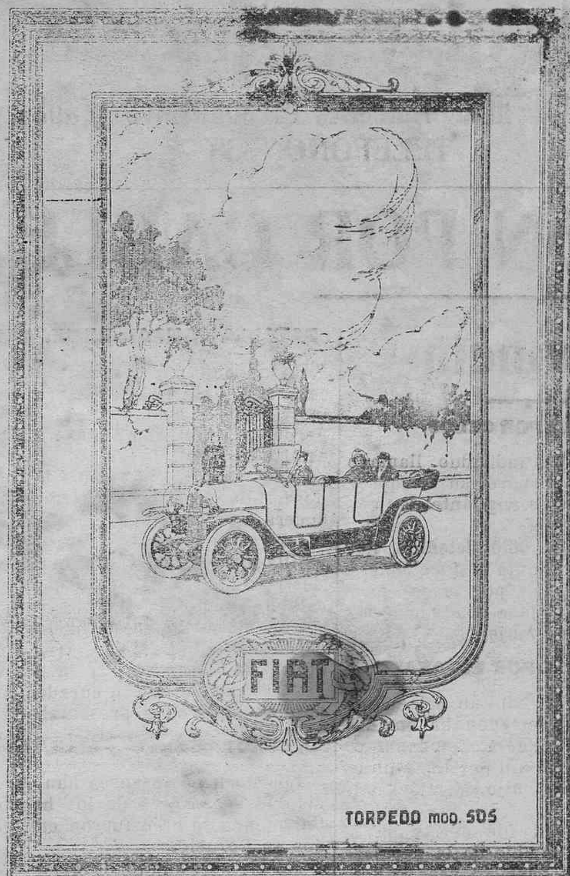
TORPEDO MOD. 505