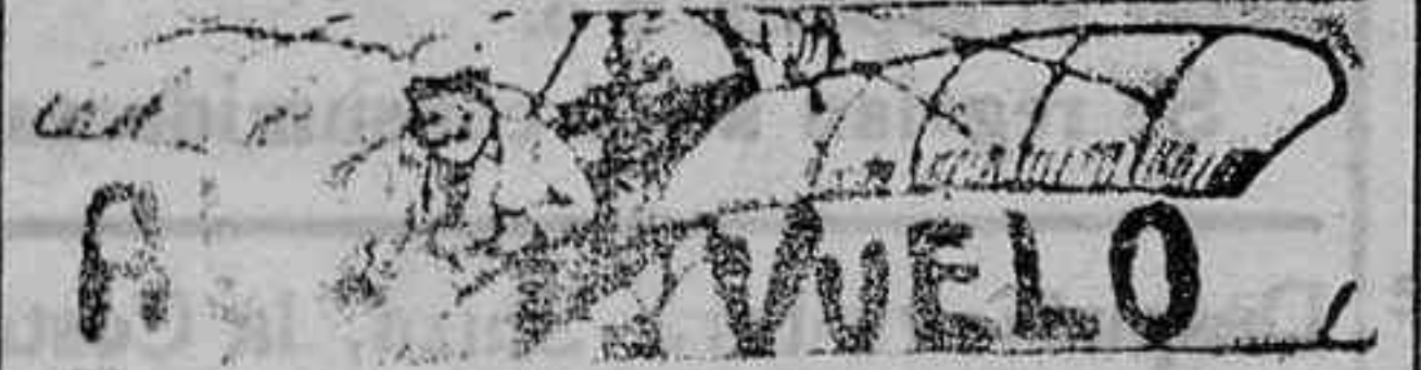
«Ojos que matan dulcemente»...

Las Delegaciones de la Asociación Canaria en el campo también celebrarán fiestas de homenaje al gran Galdós, funciones teatrales, bailes, juegos de pelota, contando con el concurso de los Liceos cubanos, las colonias españolas y las delegaciones de los Centros Asturiano Gallego y Asociación de Dependientes.