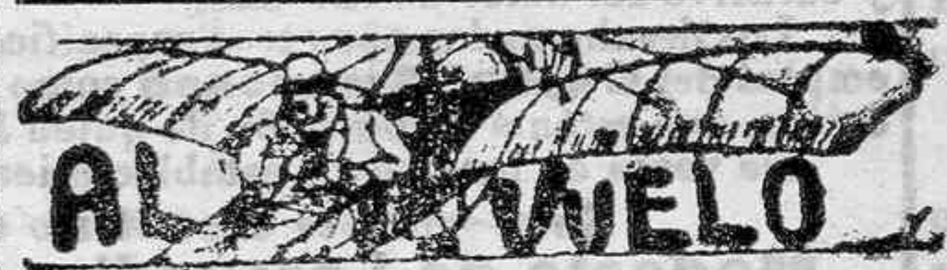
¿Dónde están los hombres?