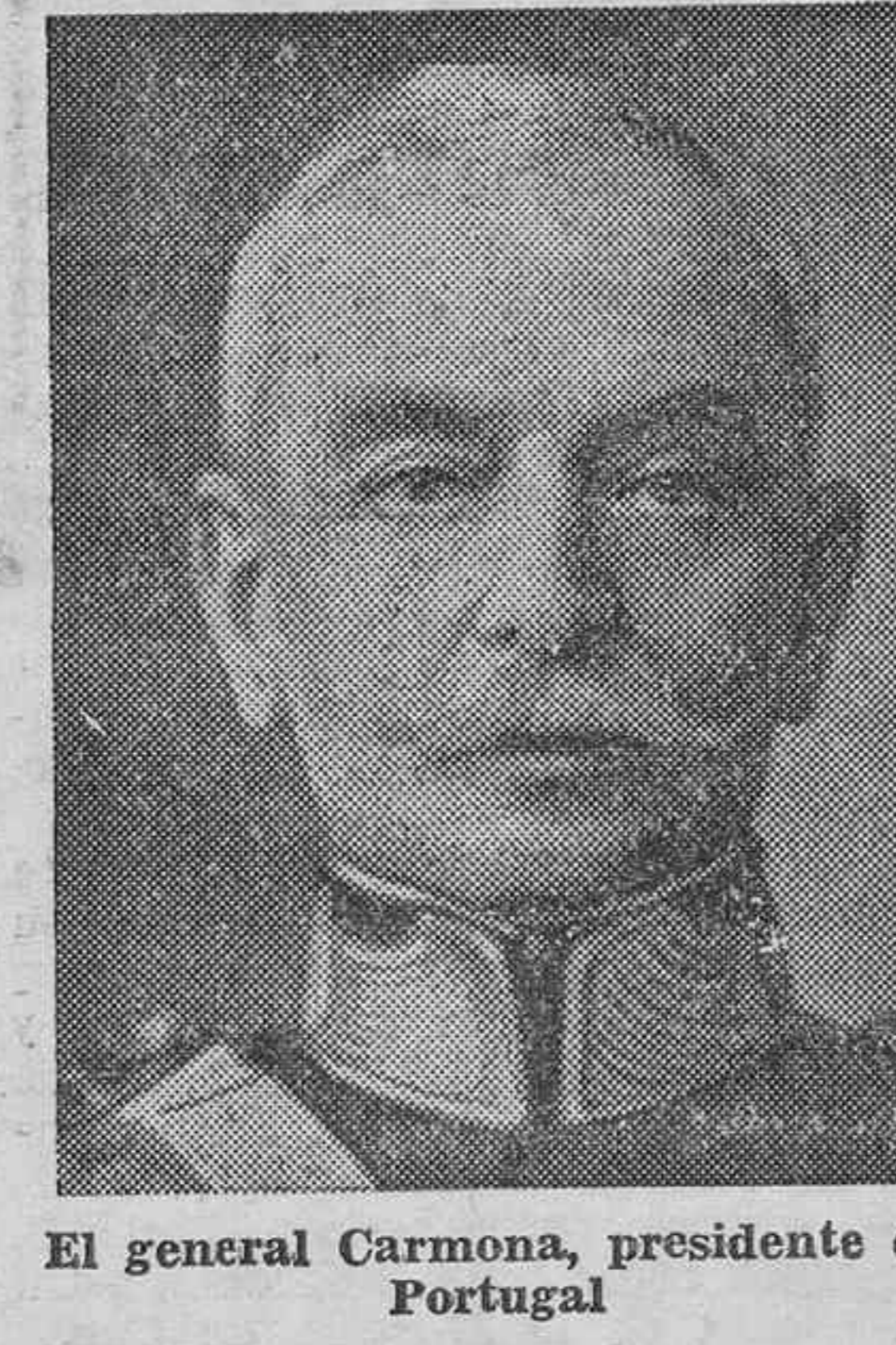
El general Carmona, presidente de Portugal

En un buque de nacionalidad francesa embarcaron los cónsules de Francia y Bélgica, los miembros de la Cruz Roja Internacional y otros siete extranjeros.