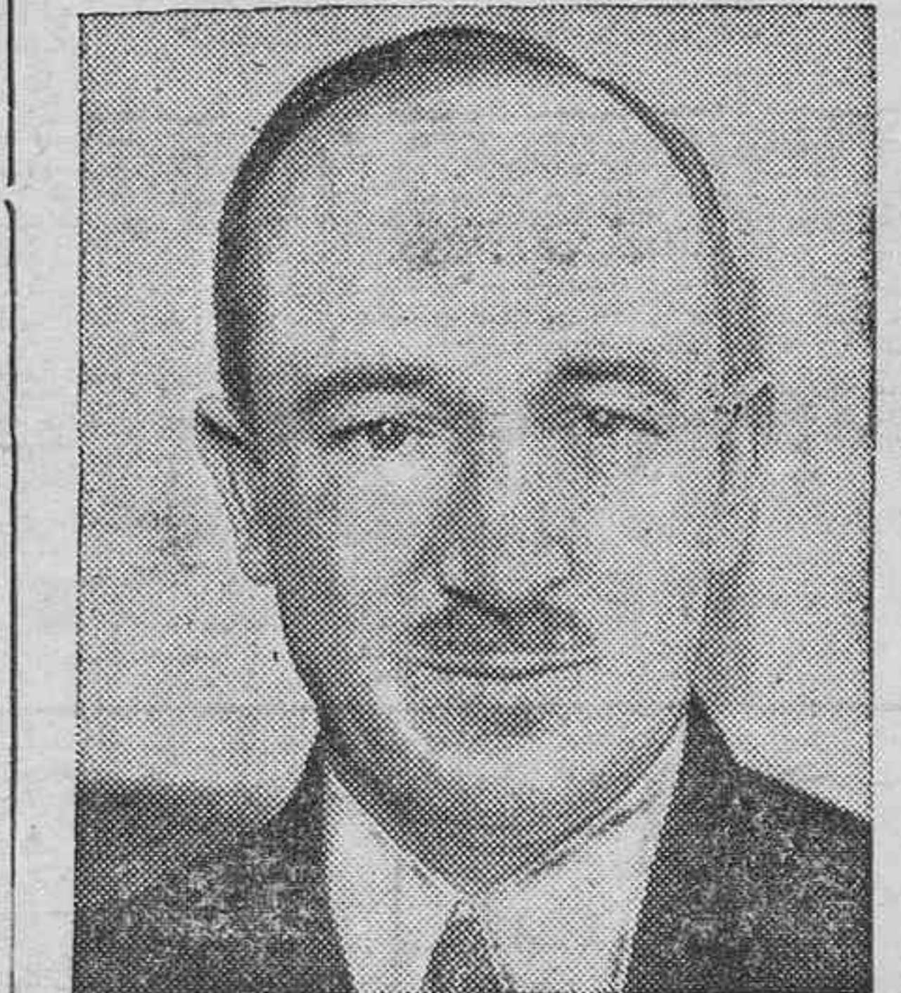
El doctor Benes, presidente de Checoslovaquia

Esperemos ahora que la niebla y la lluvia no persistirán en el Norte, y que al sol le gustará contemplar el avance arrollador de nuestros soldados en el frente de Santander. (E.A.—8.—A.S.).