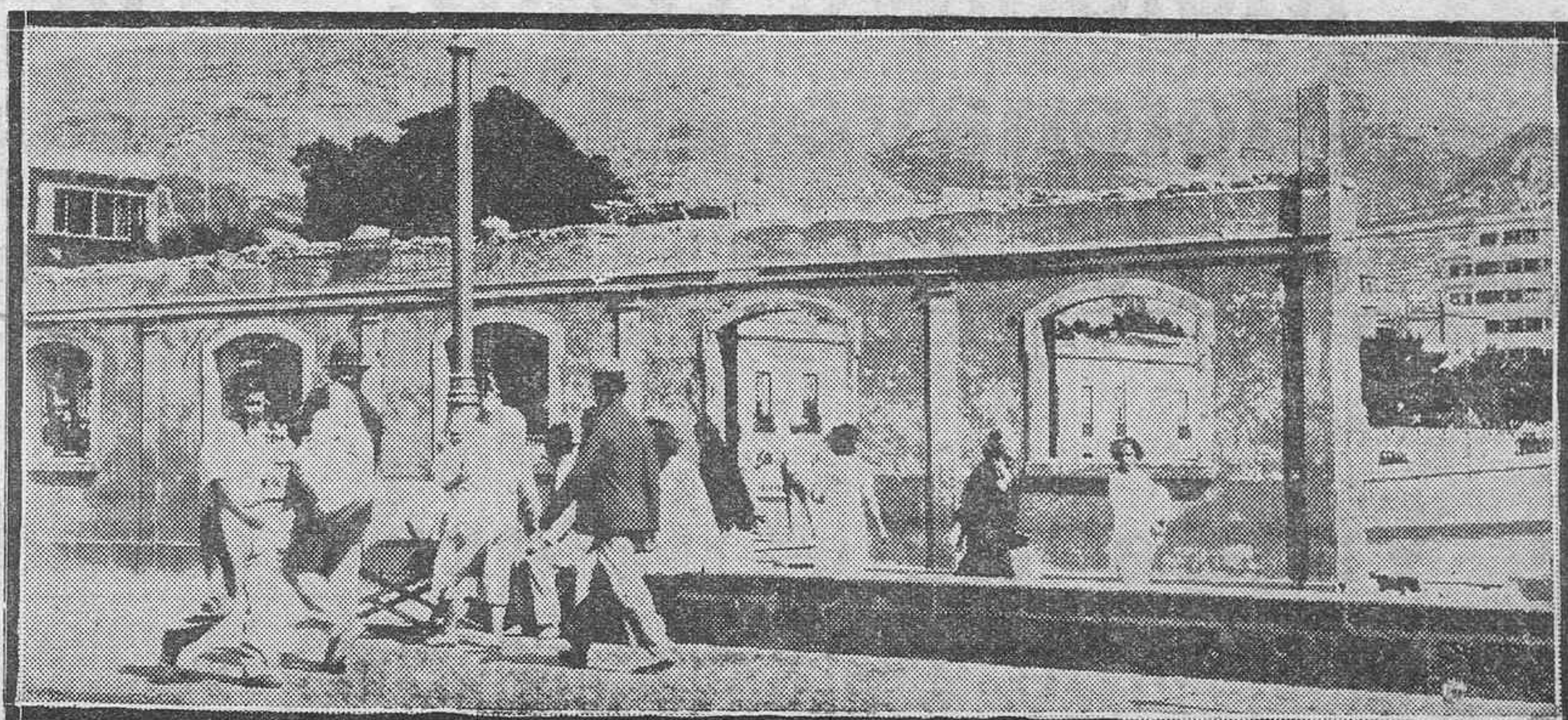
LA DEMOLICION DE LOS ALMACENES DE RUIZ.—Una de las fases finales del derribo, cuando todavía quedaban en pie los muros de fachada que, al desaparecer por completo, abren perspectivas insospechadas a la entrada de la ciudad.

Cree, sin embargo, el Gobierno de Chile, que tal gestión carecerá de eficacia por el carácter de la cuestión que en España se dilucida.