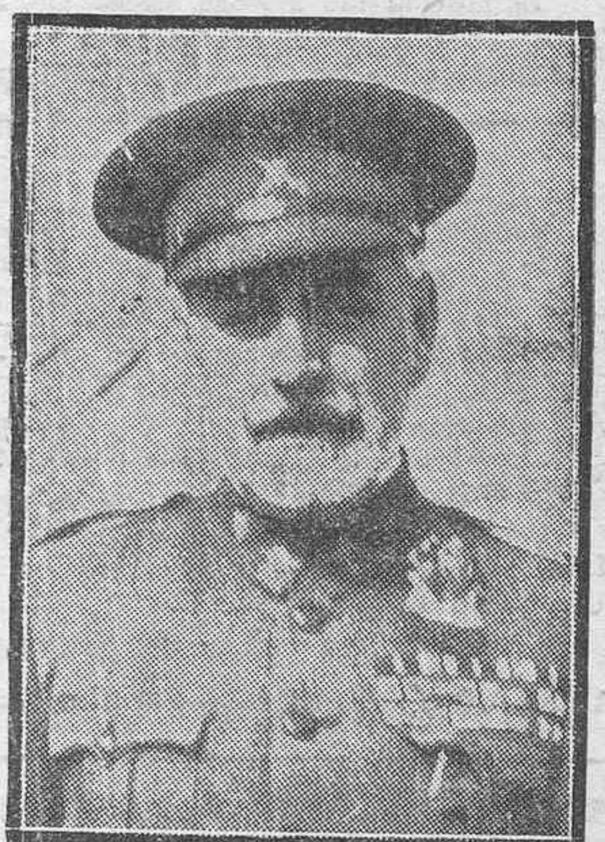
El general Fanjul, comandante militar que fué de Canarias, que ha sido fusilado en Madrid por las milicias rojas.