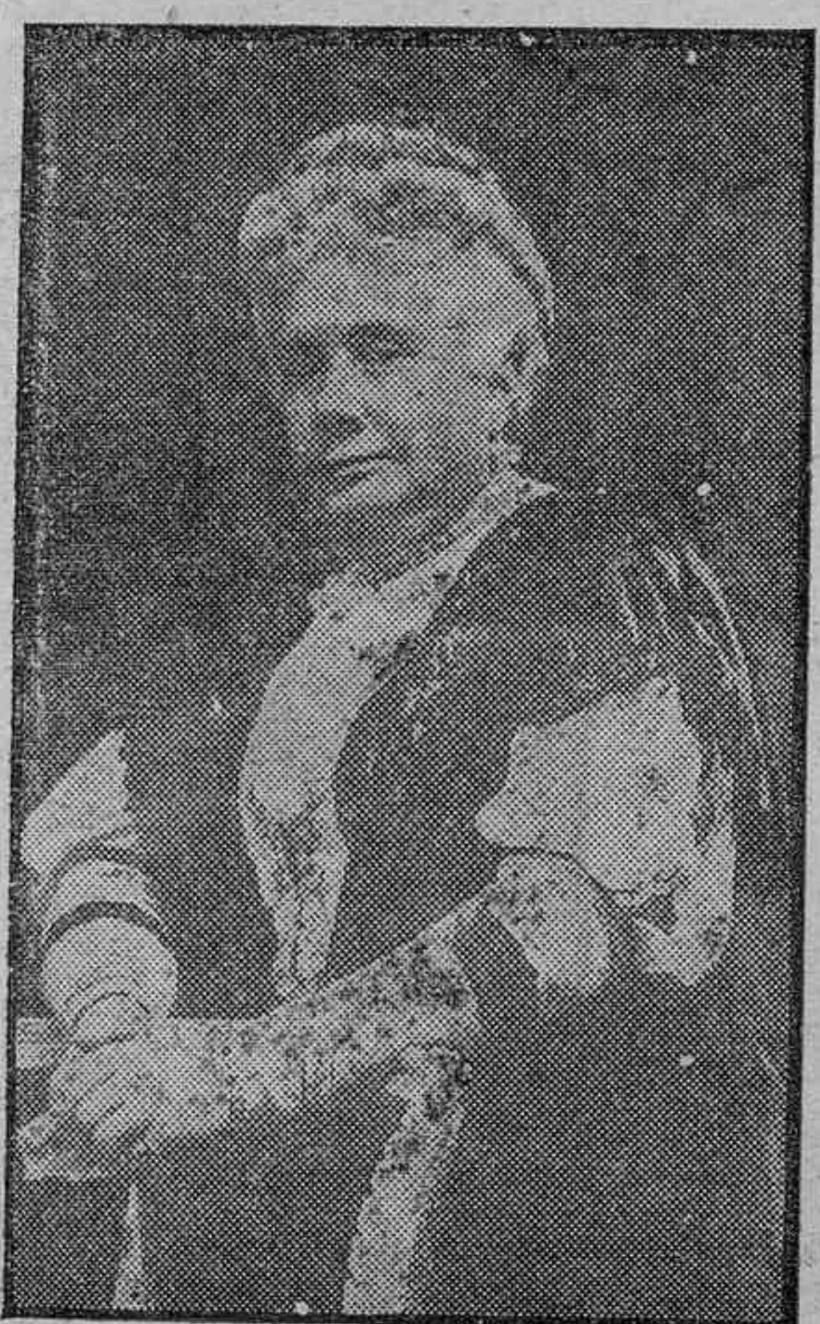
Doña Isabel de Borbón, que ha fallecido en Auteuil (París), a los 80 años de edad.

Oro por razones mil en muchos republicanos, pero nunca en los... «tempranos», los del catorce de abril.