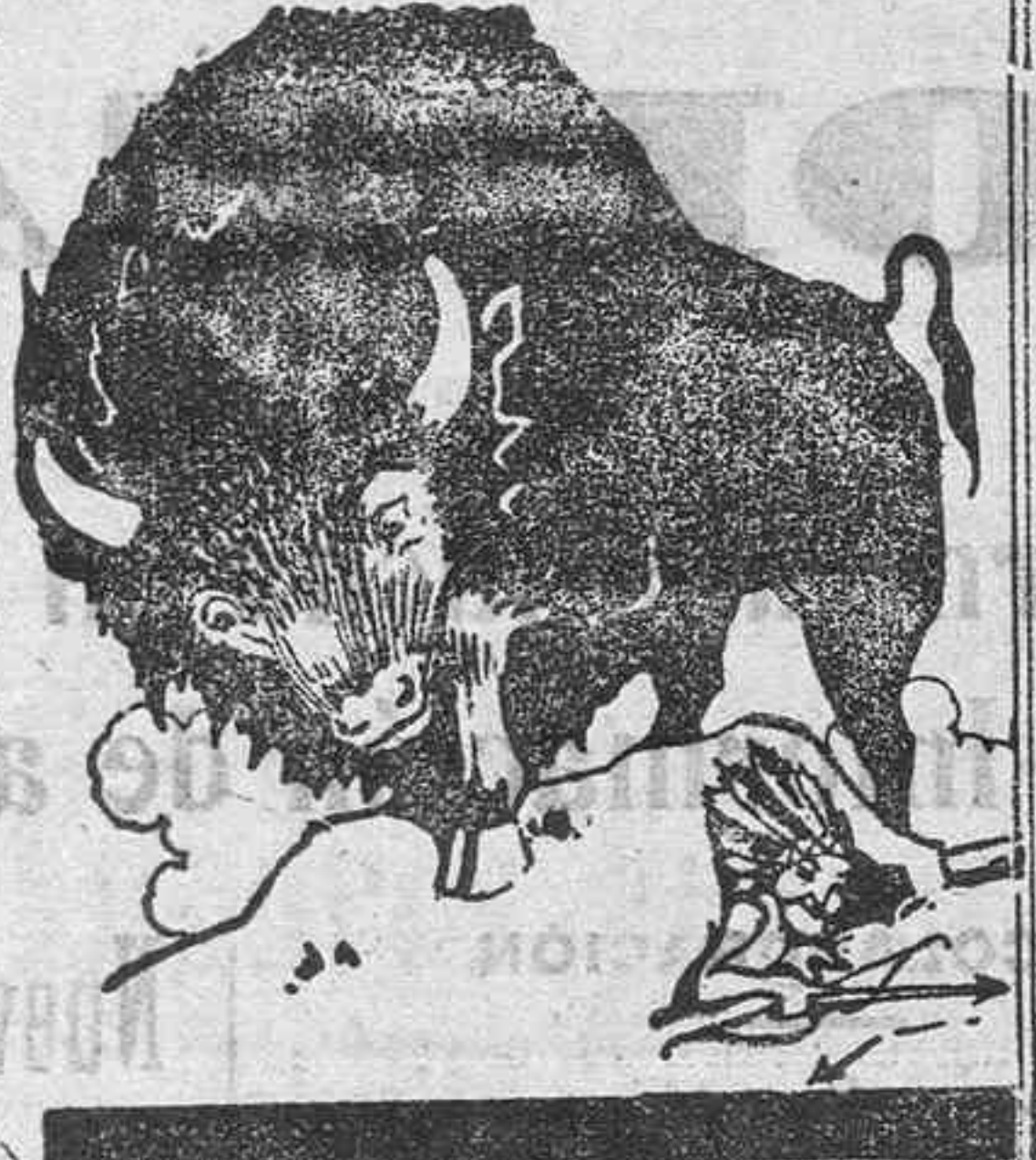
Pruébalo y aborre su tiempo y su dinero.

el lavado se termina rápidamente. El trabajo se aminora con su uso, se gana tiempo y se conservan las ropas. El Sunlight Jabón hace todo el trabajo. Para este objeto se ha ideado.