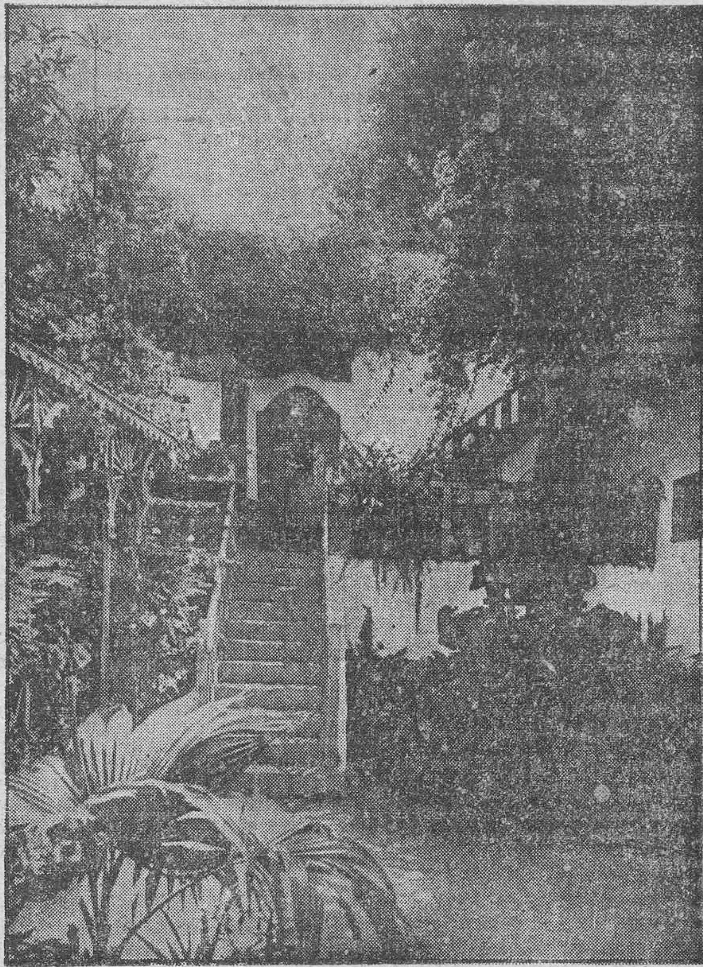
RINCONES DE TENERIFE.—(Foto A. Benítez.)

He aquí cuanto puede anticiparse sobre la labor que ocupa ahora la atención de la Asamblea Constituyente y, con ella, la de toda España.