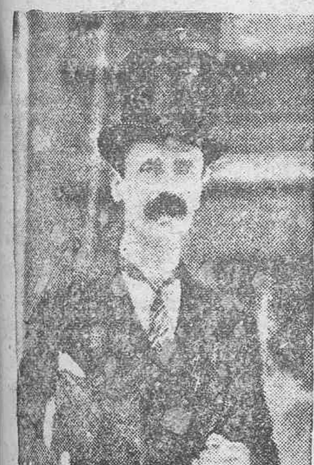
El conde de Bethlem, que según los telegramas de anoche ha presentado su dimisión como jefe del Gobierno húngaro provocando una grave crisis en aquel país

Ventas al contado y a plazos. TEOBALDO POWER, 4 Y 1