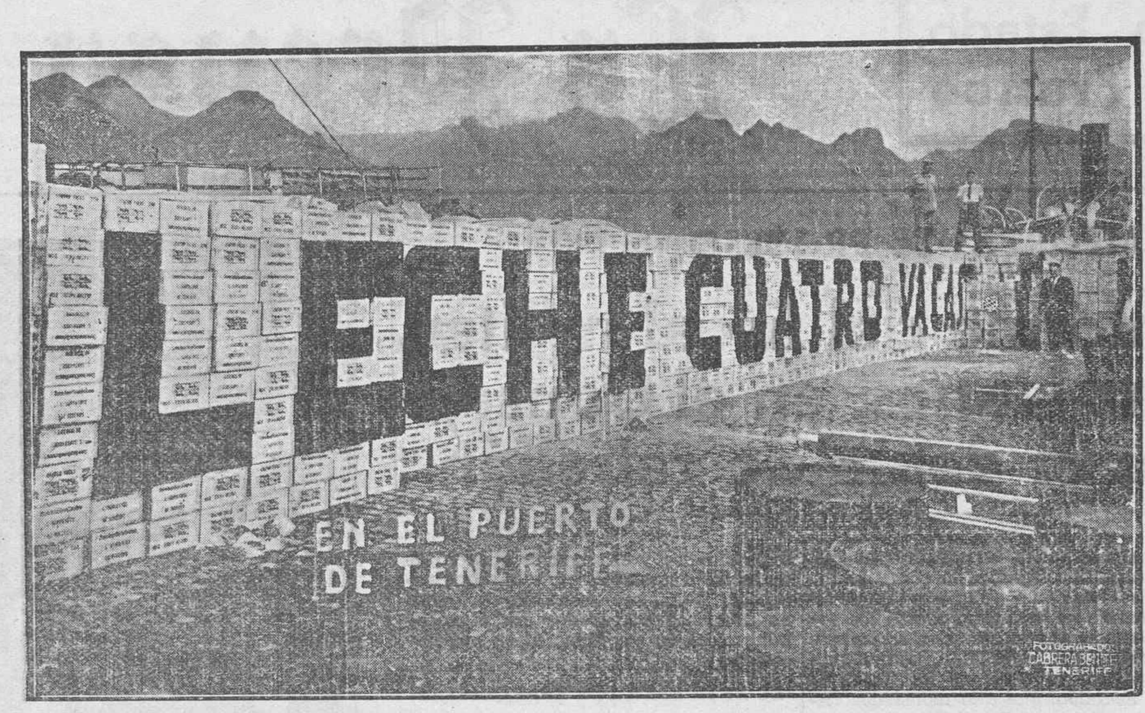
Detalle del pedido de 3.000 cajas de leche condensada "CUATRO VACAS", llegadas ayer al puerto de esta capital, por el vapor "Schleswing". Los fabricantes señores Cooperativa de Bedun (Hlanda), han hecho un donativo de cajas de esta insuperable leche, a nuestro valiente Ejército.