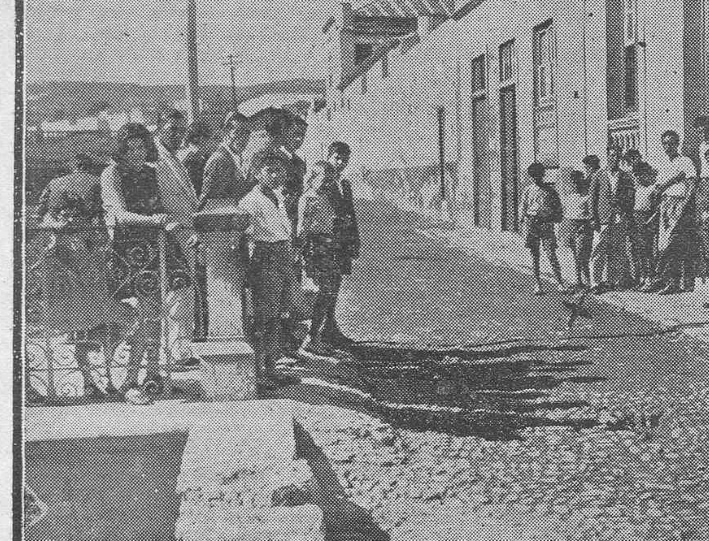
DEL ATENTADO CONTRA LOS GUARDIAS DE ASALTO.—Sitio donde fué recogido el cadáver de una de las víctimas.