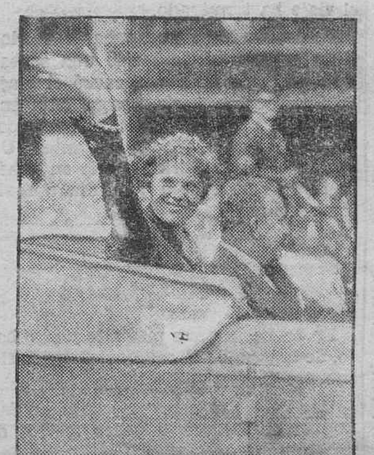
La intrépida aviadora americana Amelia Earhart, que ha hecho un vuelo "record" de 2.100 millas sin escalas, desde Méjico, realizó en catorce horas, diez y ocho minutos y treinta y cinco segundos. Una gran muchedumbre la aclamó al regresar a Nueva York.