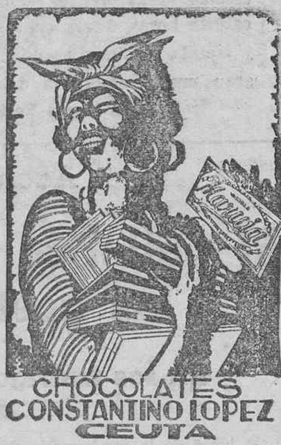
CHOCOLATES CONSTANTINO LOPEZ CEUTA