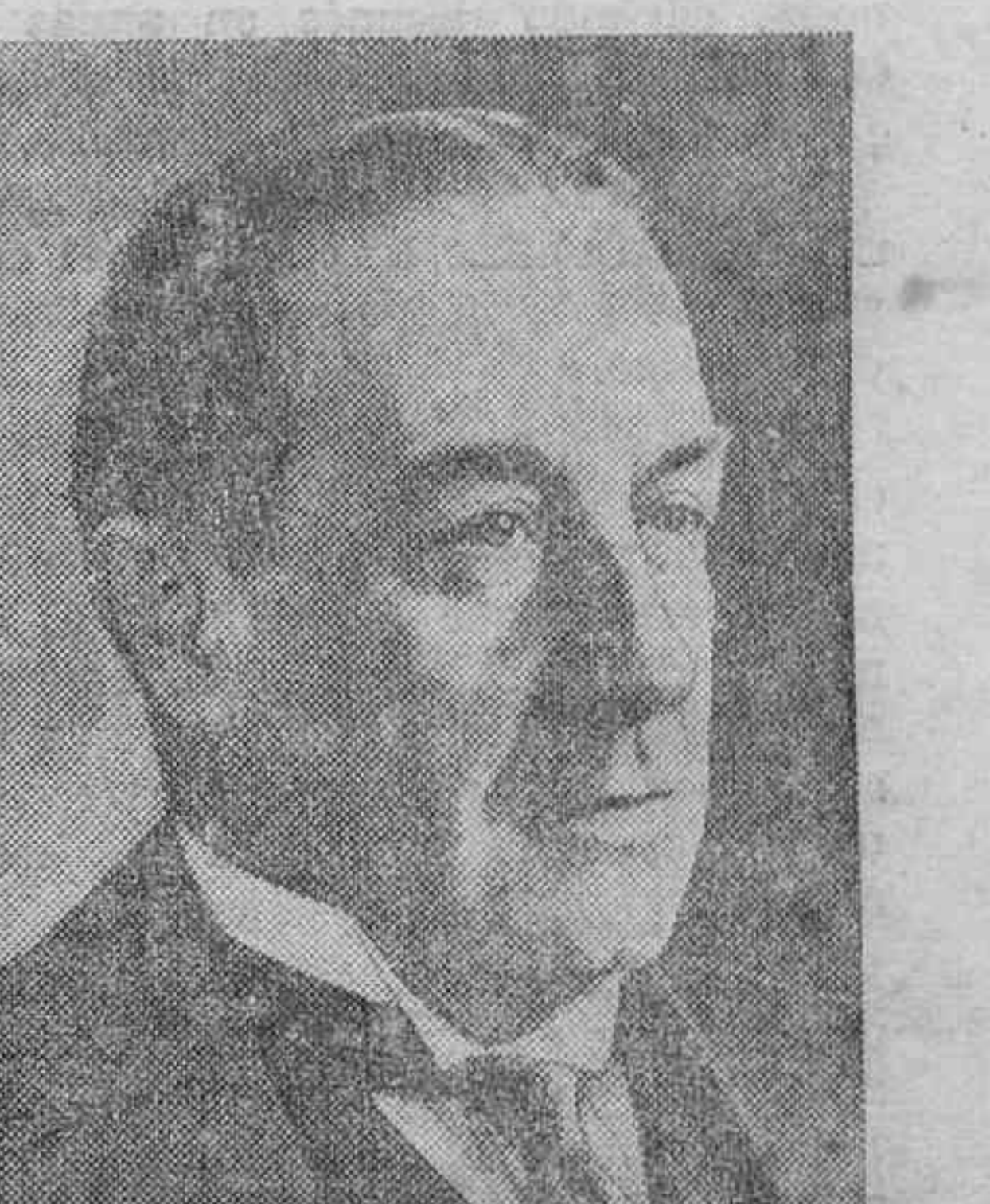
Mr. Baldwin, el jefe de los conservadores ingleses, que se dice va a encargarse de la presidencia del Gobierno por dimisión de M. Mac Donald, al que los médicos han aconsejado absoluto reposo. De confirmarse esta sustitución, parece que habría algunos cambios de carteras