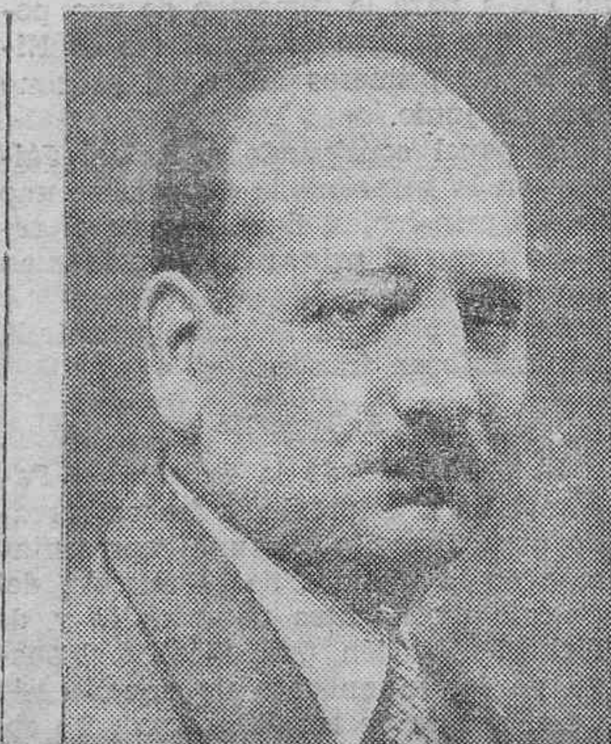
El jefe del Gobierno francés, M. Flandin, que restablecido del grave percance automovilista que sufrió últimamente, ha asistido en el Havre a la inauguración oficial del gran trasatlántico "Normandie". M. Flandin pronunció un discurso aludiendo a la situación económica de Francia y afirmando la necesidad de recabar poderes especiales

Ya él lo había atisbado con sus ojos niños, y lo había comprobado con su ojeada firme de adolescente y reafirmado en su visión de varón recio. Pero eran los tiempos del plátano, de las cotizaciones fabulosas, de los falos de oro que fecundaban la flaca economía