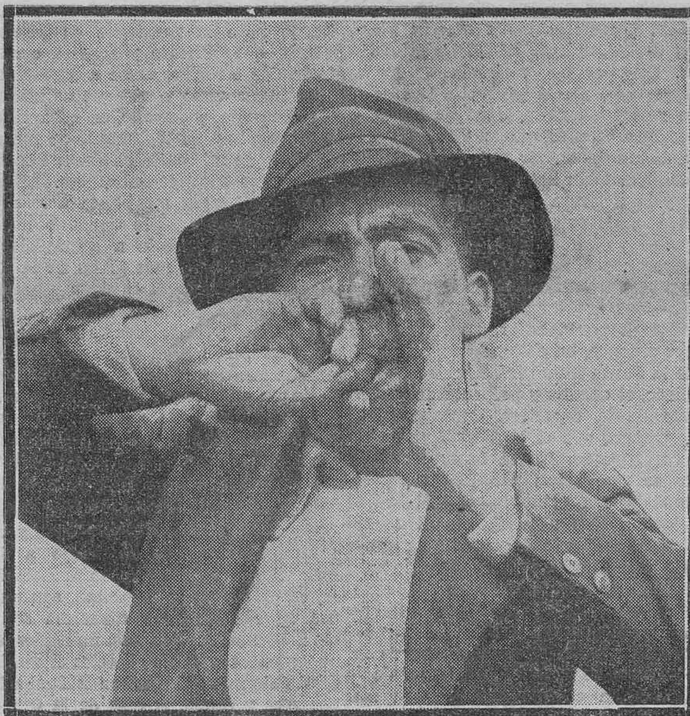
EL FONEMA SILBADO

En la fiesta regional celebrada el domingo último en la Plaza de Toros, se presentó un número interesantísimo: dos pastores gomeros colocados a gran distancia traducían por medio de silbidos cuanto se les decía, realizando inmediatamente lo que se les ordenaba. Era una exhibición curiosa del llamado lenguaje silbado, que aún perdura en la isla de la Gomera, cuyo origen es de una antigüedad probada. El primer testimonio que poseemos de esa manera de expresar el pensamiento en la ciudad isla, lo hallamos en el "Canarién", crónica de la conquista de las islas de Lanzarote, Hierro y Fuerteventura, por Gadir de la Salle y Juan de Bethencourt, escrita por los años 1402-1404, y publicada por Pierre Magry en 1896, donde, al hablar de la Gomera, dice: