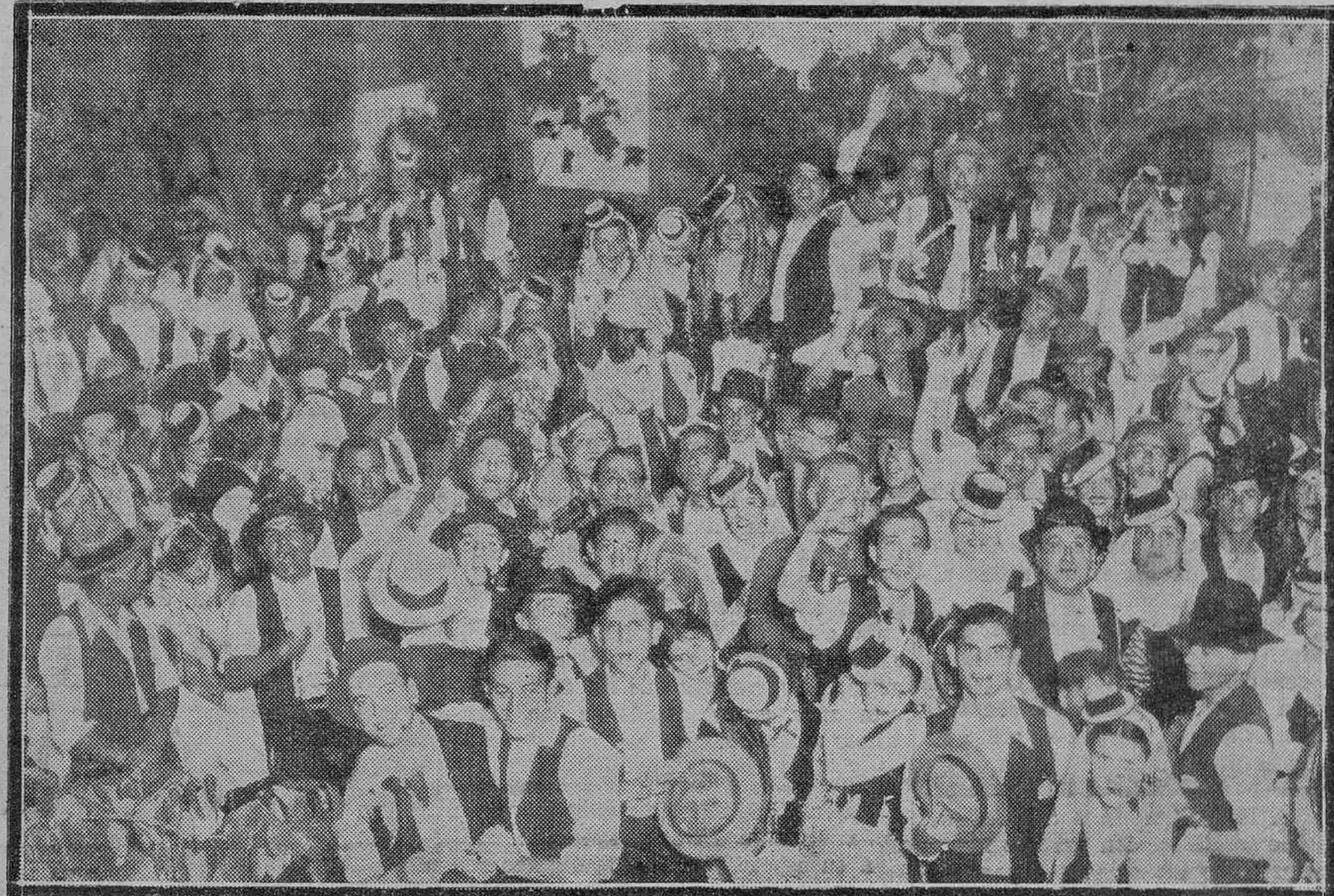
Un detalle de la brillante fiesta regional celebrada anteanoche en el Teatro Guimera, que constituyó un resonante éxito para sus organizadores.

Las fiestas de mayo han tenido este año un número cumbre: el baile regional del martes en el Teatro Guimera, organizado con todo entusiasmo por la Masa Coral Tinerfeña.