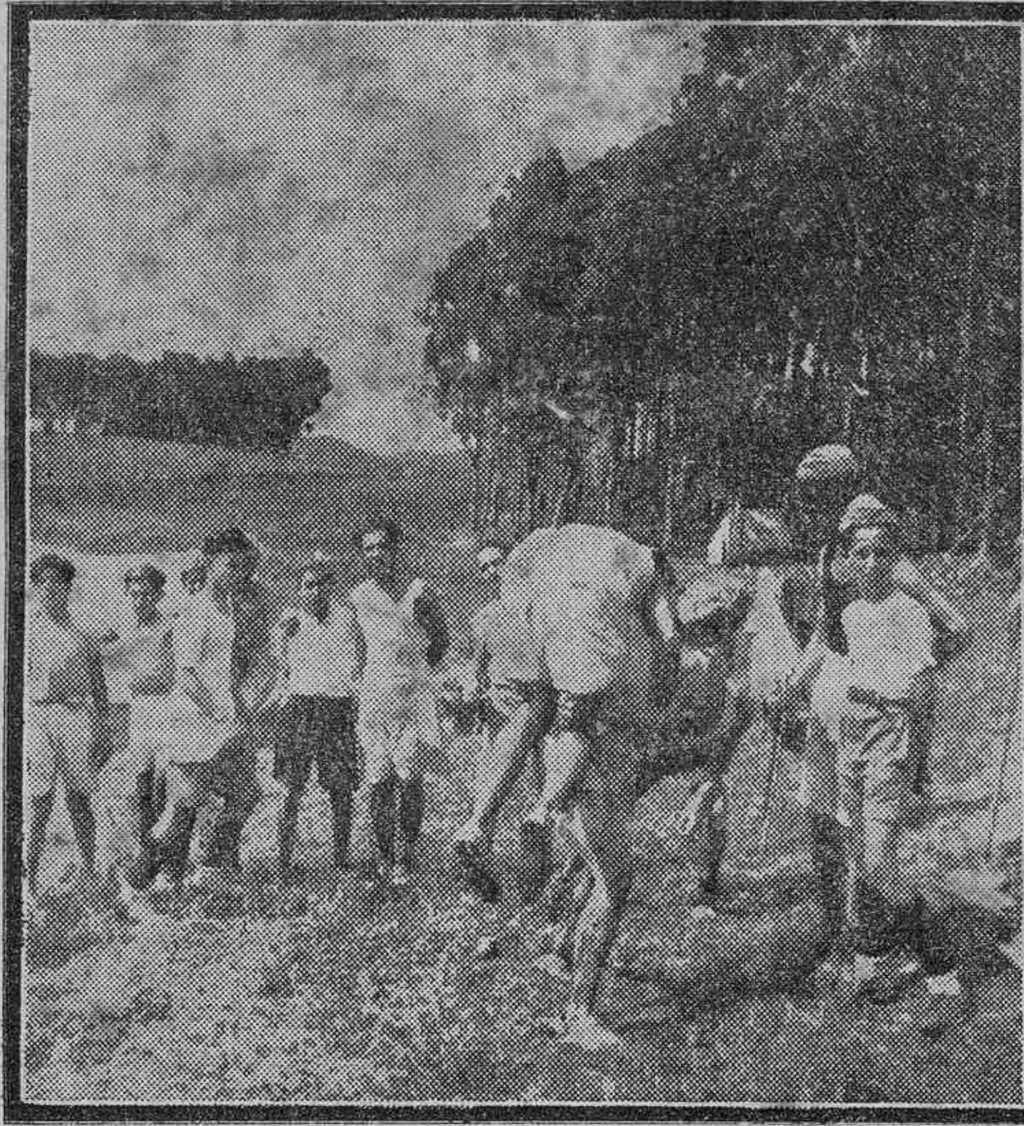
En el campamento de la Esperanza.