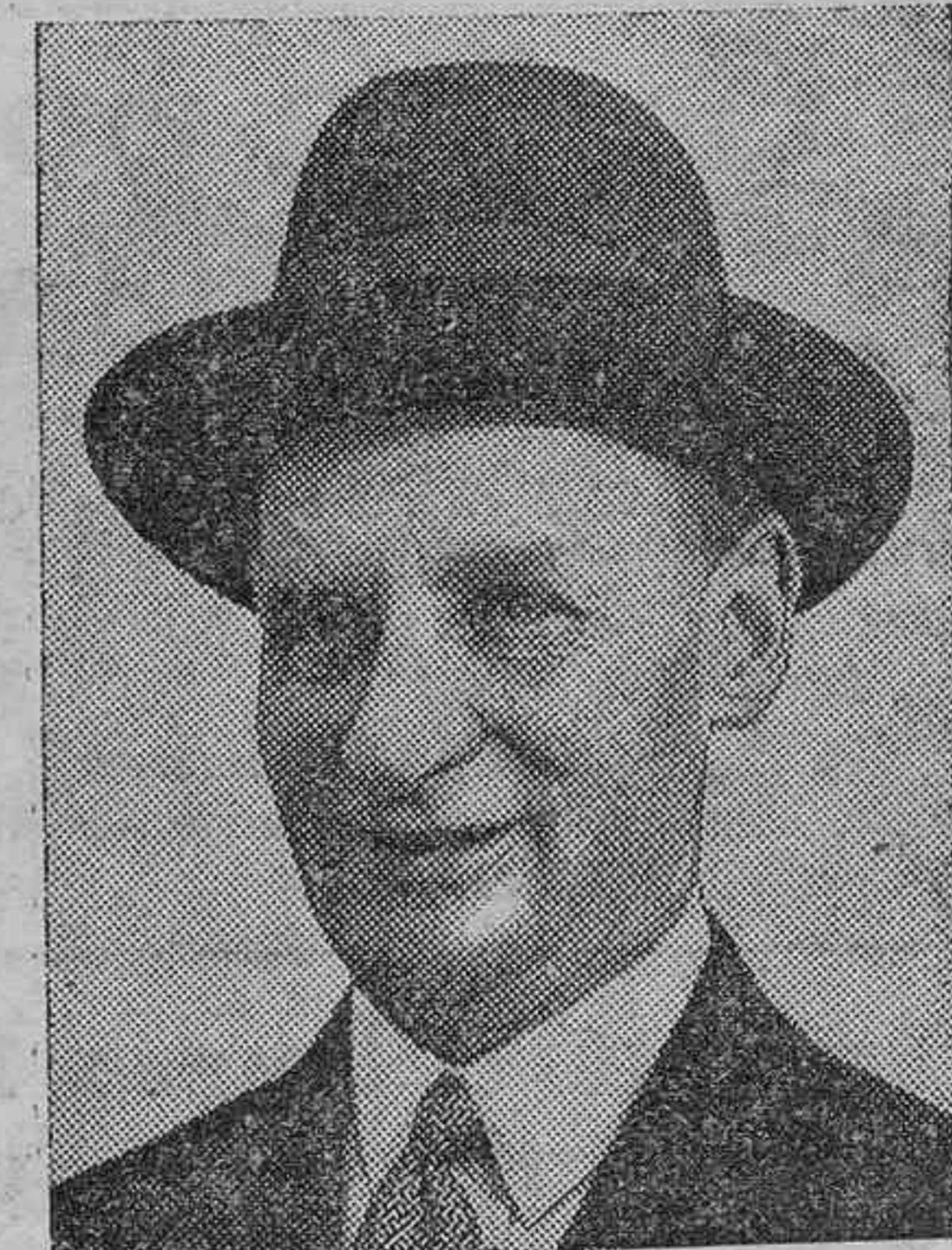
Mr. Knox, presidente de la Comisión gubernamental en el distrito del Sarre.