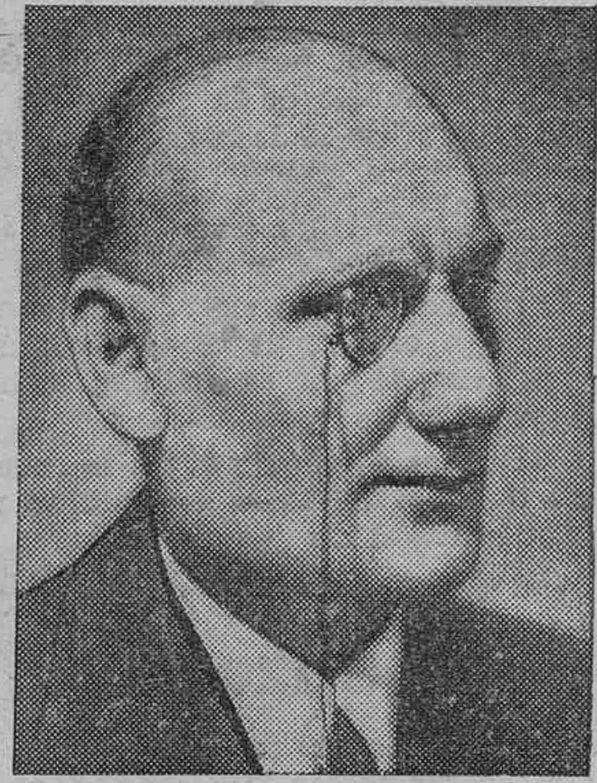
El barón Aloisi, presidente de la Comisión de la Sociedad de las Naciones, en la votación del Sarre.