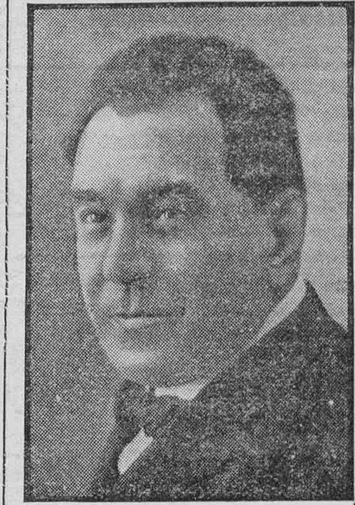
El maestro Vives

He aquí una sucinta relación biográfica del músico ilustre que España acaba de perder.