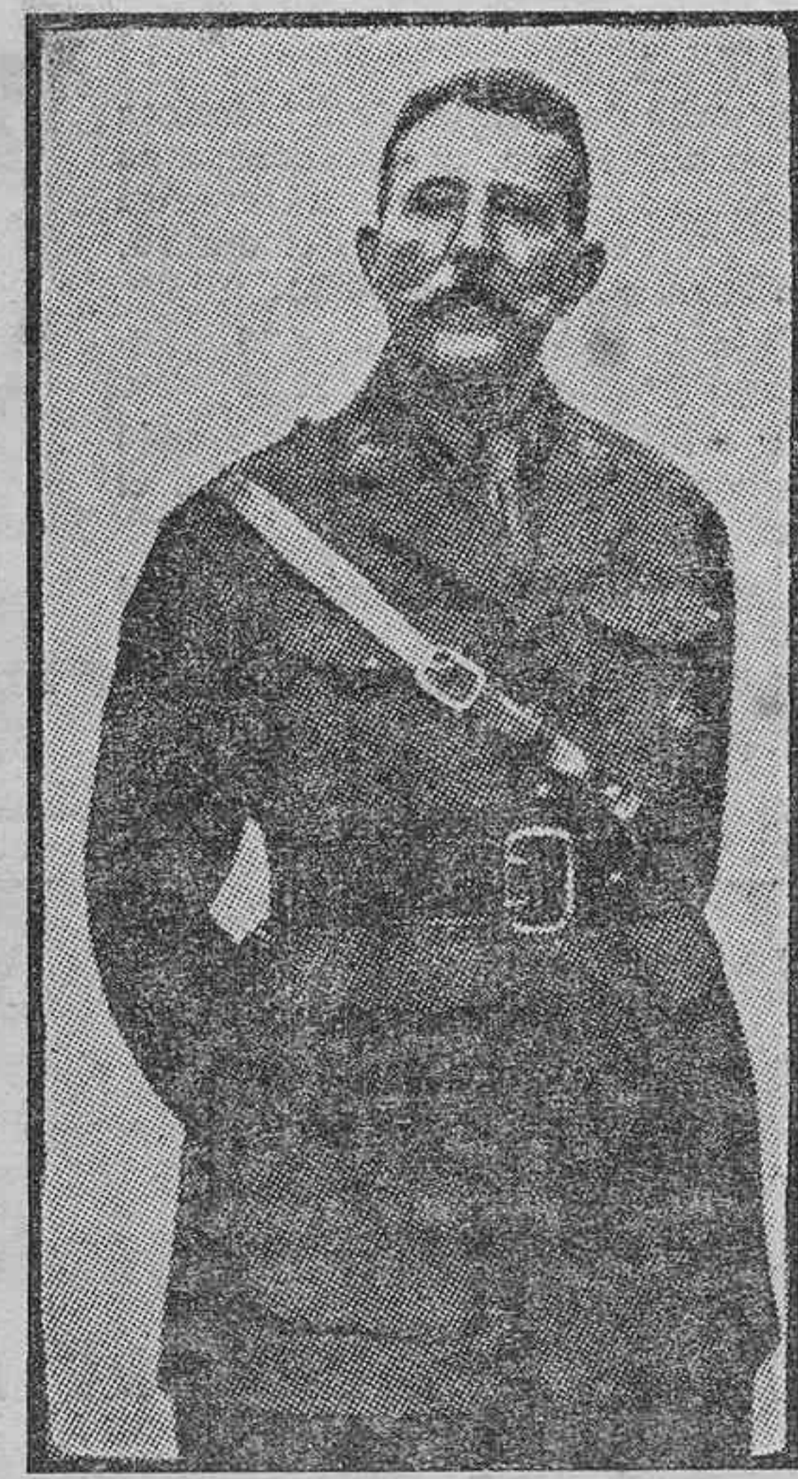
El general Cavalcanti, que según los telegramas de anoche fué detenido en San Sebastián...