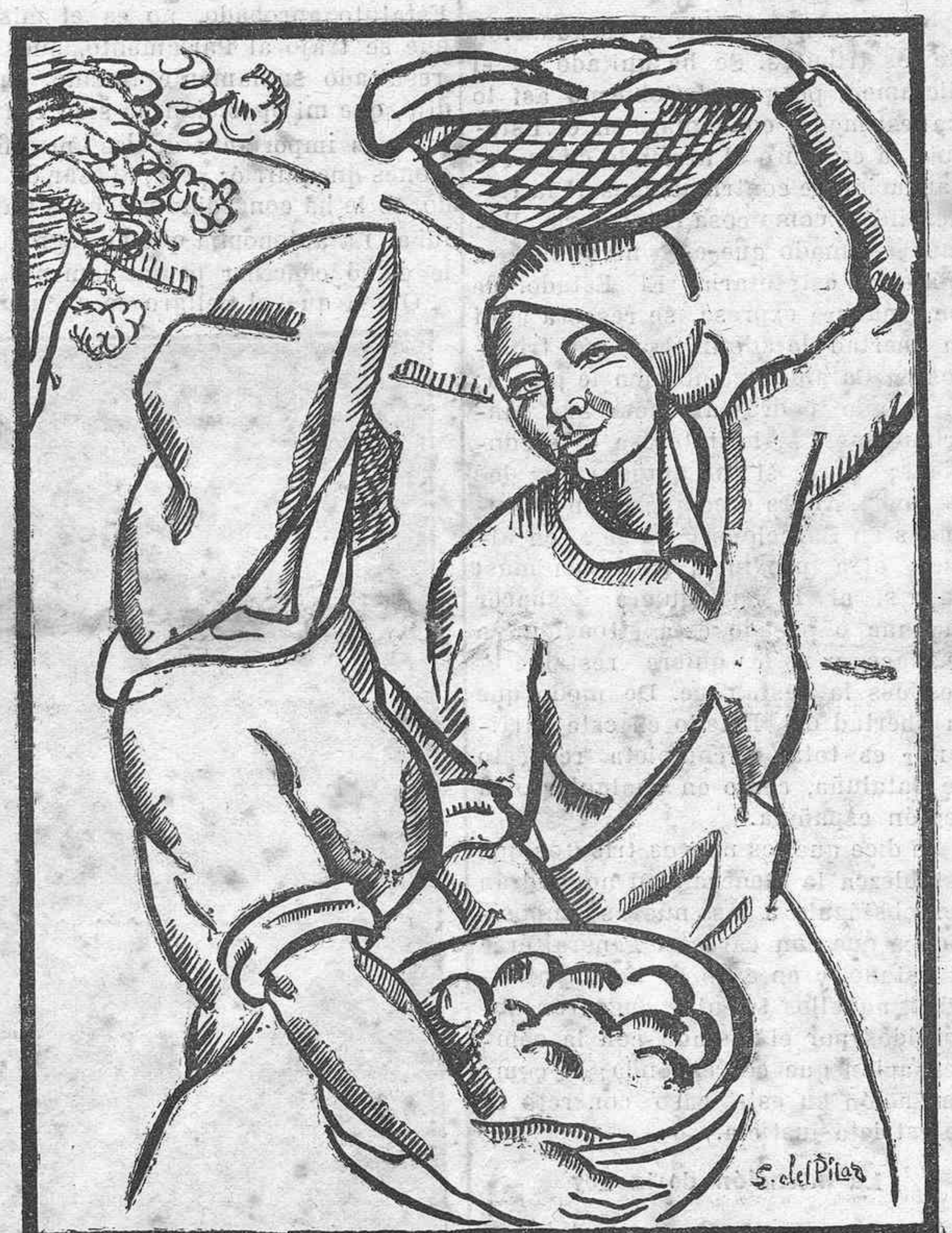
CAMPESINAS TINTERFENAS. —Apunte de Servando del Pilar

gundas manos sean tan deseadas como las primitivas? Puede ocurrir y ocurriría en algunos casos, tal vez en más de los que nos figuramos. Sin embargo, todos nos reiríamos de quien no quitase un mendrugo al pobre de la esquina, ya harto o inapetente, sólo por la consideración de que el pobre inmediato tampoco lo había de roer. Valdría tanto el sistema como no admitir una hipótesis con posibilidades bienhechoras porque ya teníamos una realidad más sana.