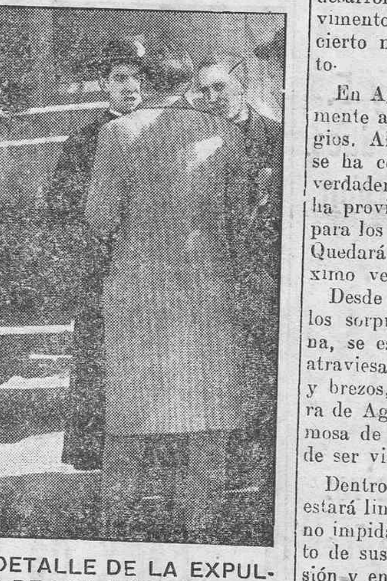
UN DETALLE DE LA EXPULSION DE LOS JESUITAS.—Momento de llegar a la frontera francesa un autobús con varios religiosos expulsados.