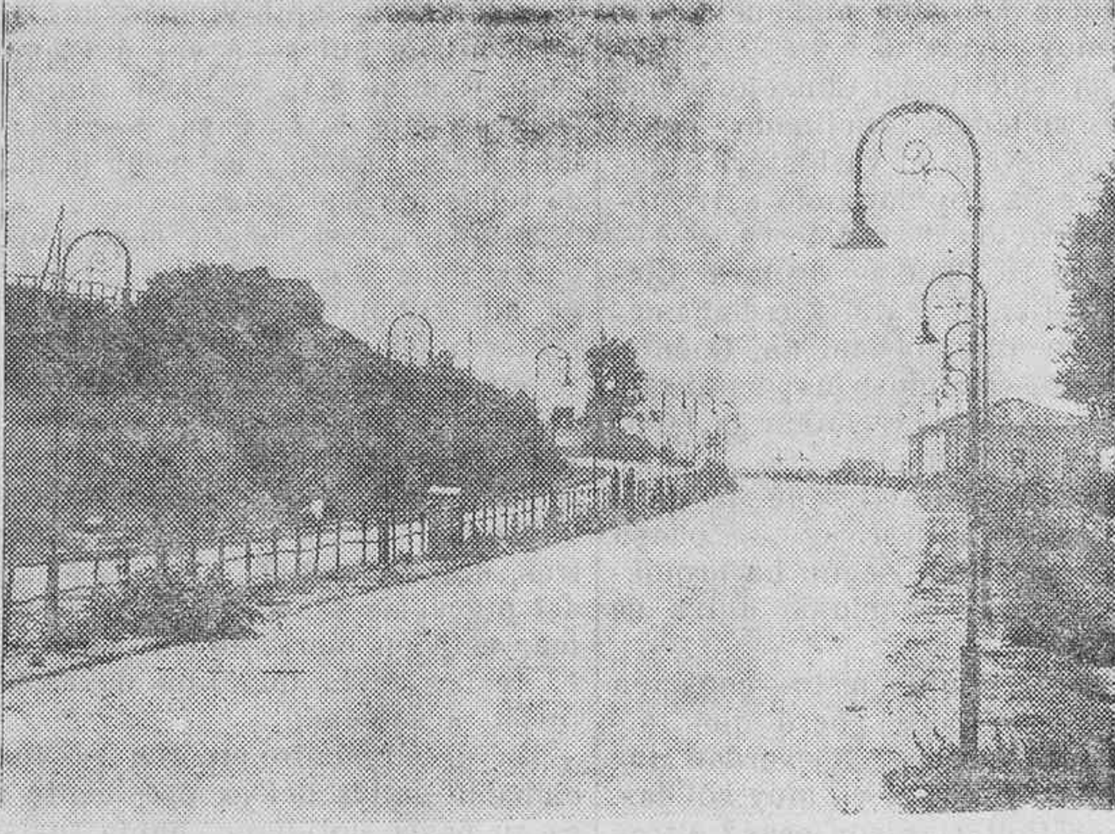
ACTUALIDADES GRAFICAS.—El príncipe de Schaumbourg Lippe trata de conquistar la popularidad haciendo acrobacias bajo un avión en pleno vuelo. Héle aquí sosteniéndose con las quijadas en un trapecio.—La famosa carretera entre Roma y Ostia, en la cual acaba de instalarse un alumbrado excelente. Los peatones no pueden penetrar en ella sino para prestar socorro en caso de accidente.