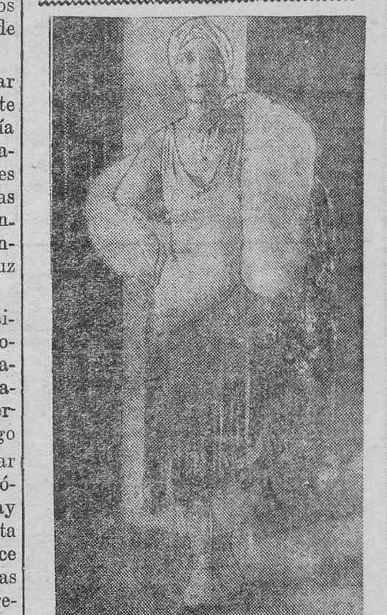
La actriz Dorothy Sebastián, en el nuevo film «On Ze Boulevard»