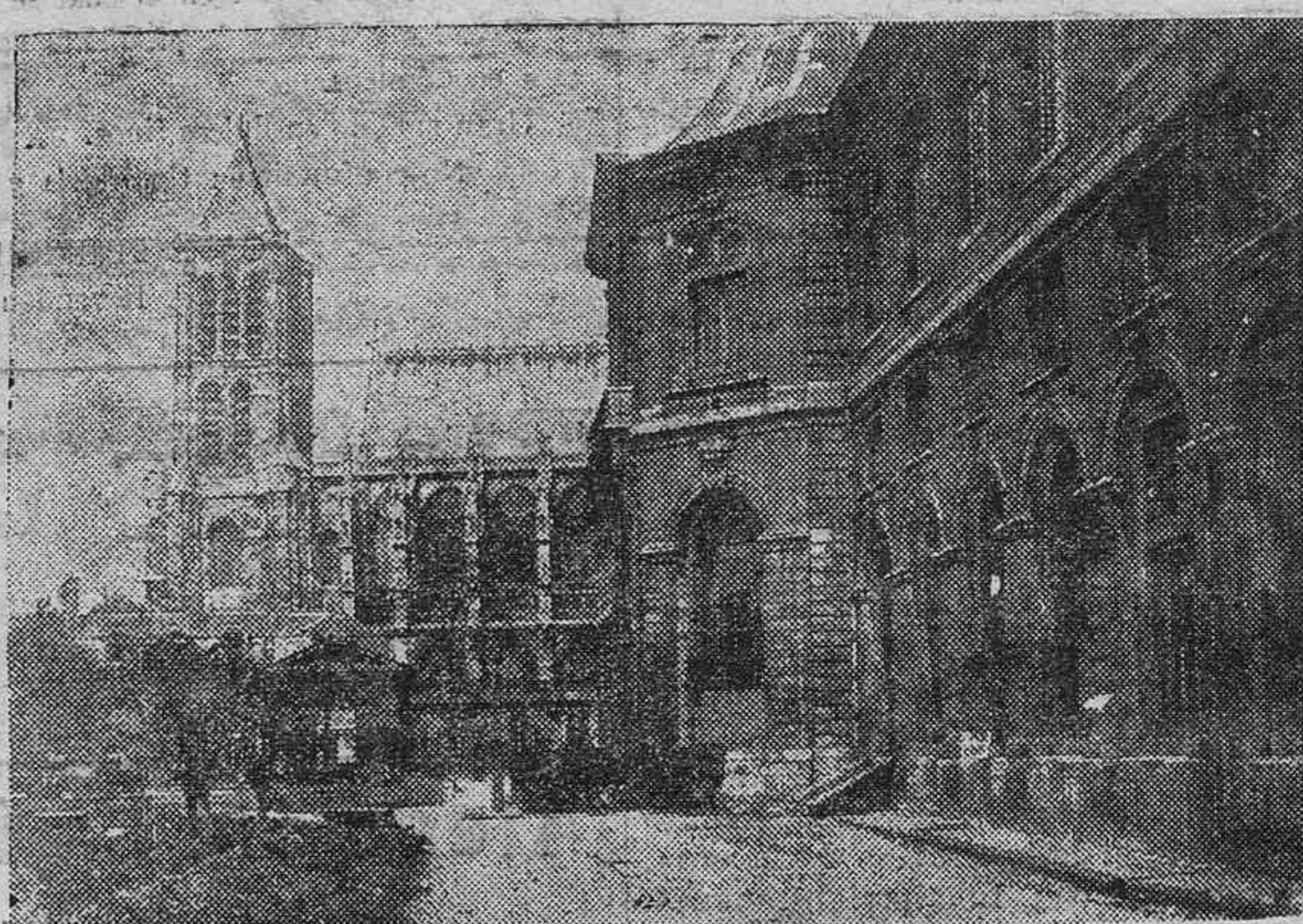
ACTUALIDADES EUROPEAS.—La casa de la Legión de Honor de Saint-Denis que va a ser derribada. Al fondo la famosa basílica de Saint-Denis.—La fiesta de los artistas franceses. La popular Mistinguette oficiando de vendedora en un establecimiento comercial, a beneficio de la caja de socorros de la Unión de los Artistas

Facturas de todas clases y de cualquier cuantía en los hoteles calificados como de lujo o de primer orden. Se consideran hoteles de lujo o de primer orden: primero, aquellos en que el precio medio de la habitación sin comida exceda de 15 pesetas diarias; segundo aquellos en que la ración media diaria por pensión completa exceda de 30 pesetas. Pensión media será la media aritmética, o sea el cociente de dividir la suma de los precios de todas las habitaciones por el número de éstas; tercero, aquellos en que sus anuncios, prospectos y propaganda hagan constar que el hotel es de lujo o de todo confort,