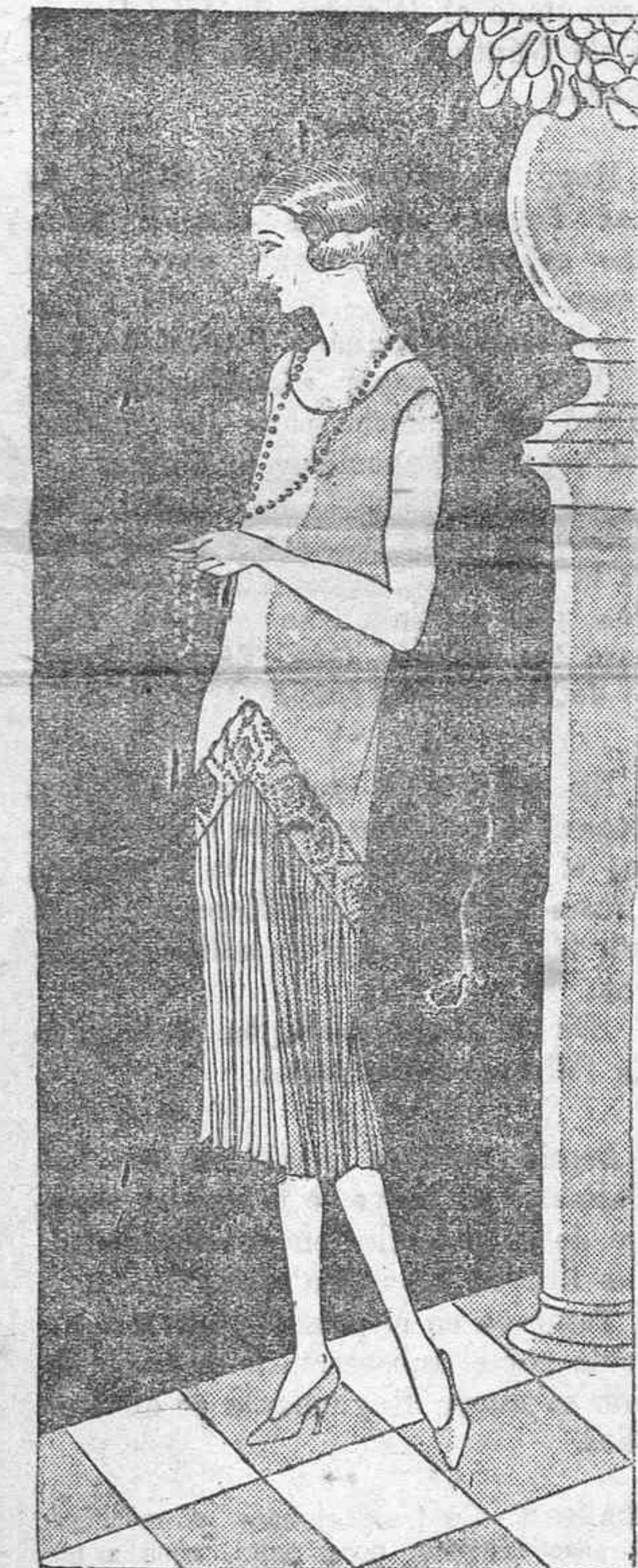
VESTIDO PARA COMIDA