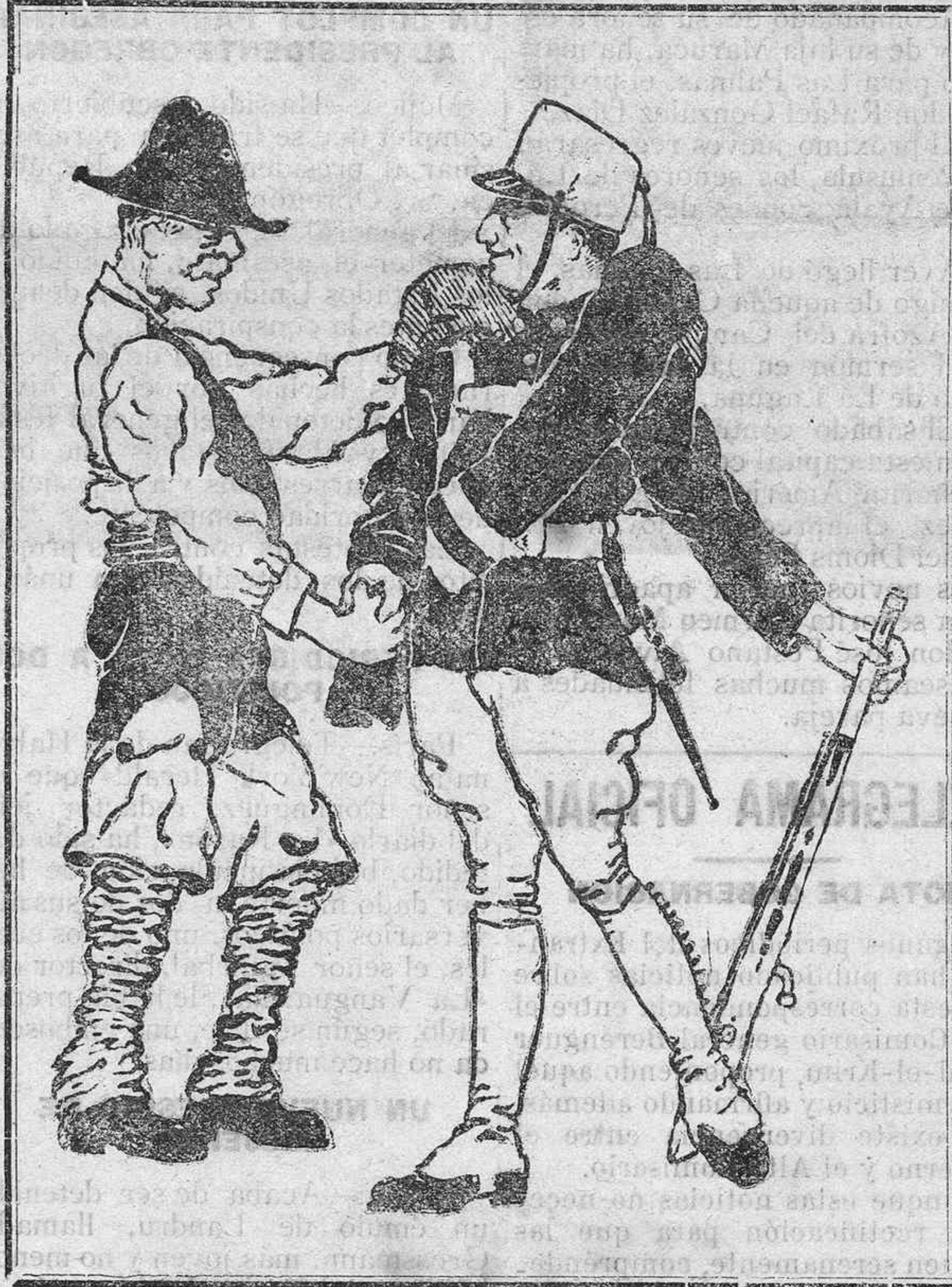
—Pos yo qué te encargo: que si vas a luchar con el moro, te deses de cumplios, y le echas el garabato que tú sabes.