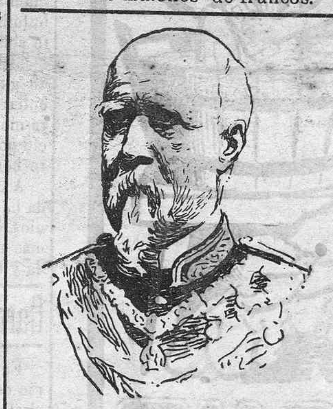
El general Azcárraga, a quien se le acaba de conceder el tercer entorchado.

Se supone fundadamente que los gastos del nuevo teatro no bajarán de unos 26 millones de francos.