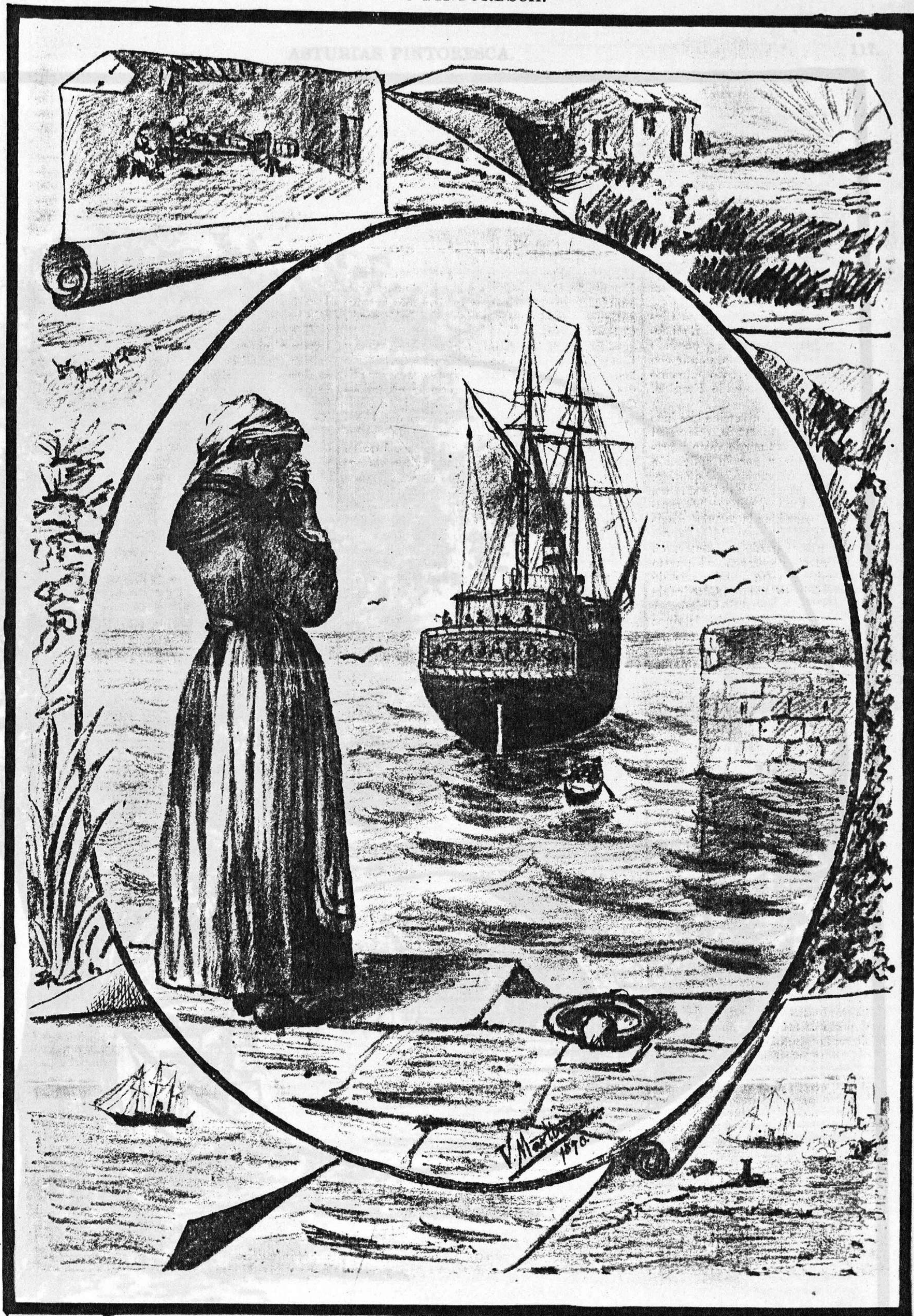
¡PROBE MADRE!... FIU, HASTA CUANDO! Sobre motivos de la poesía de Nolón así titulada y que vio la luz en el número último. (Composición y dibujo de V. Martínez.)