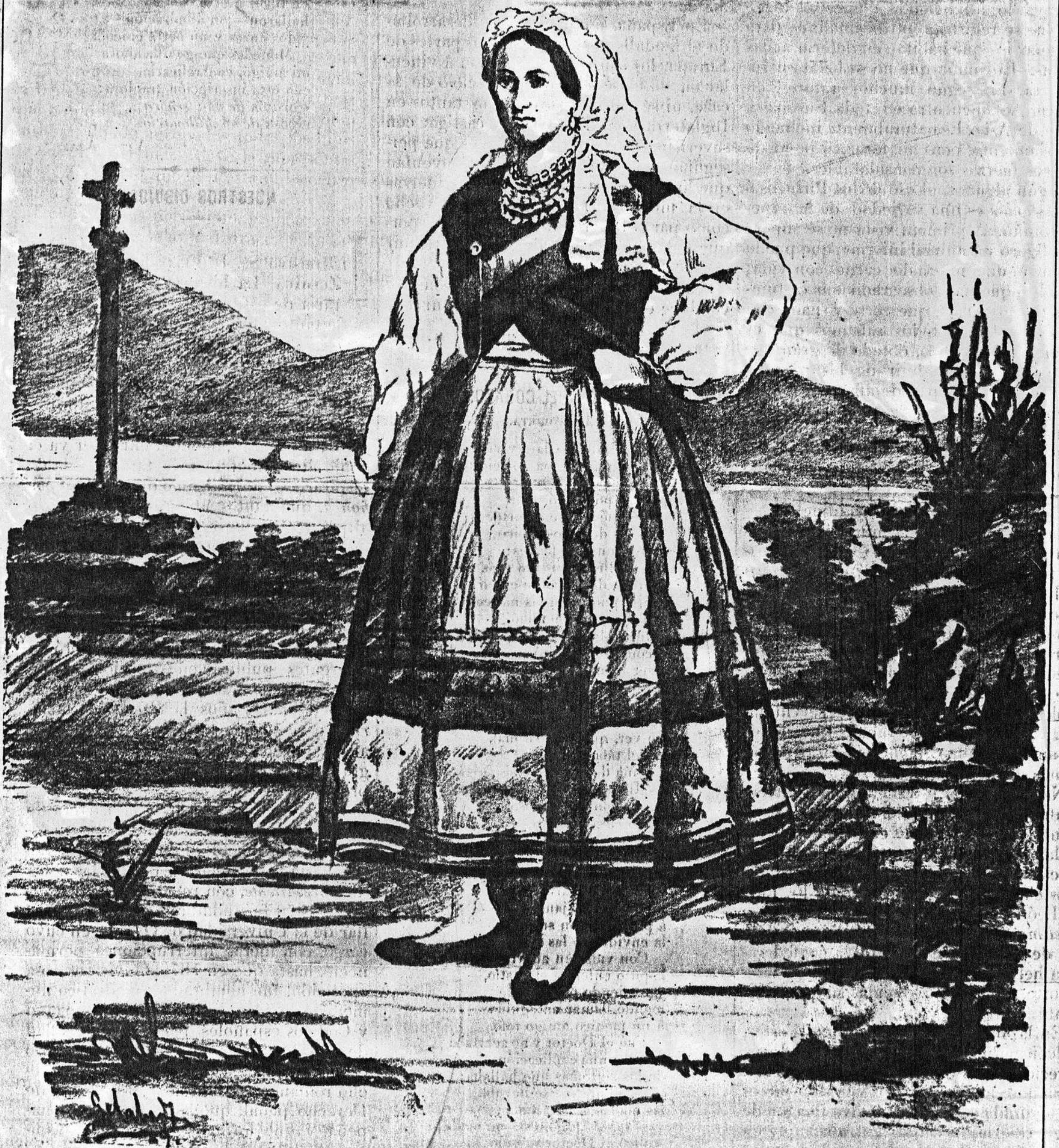
LA ALDEANA. (Dibujo de S. Gelabert.)