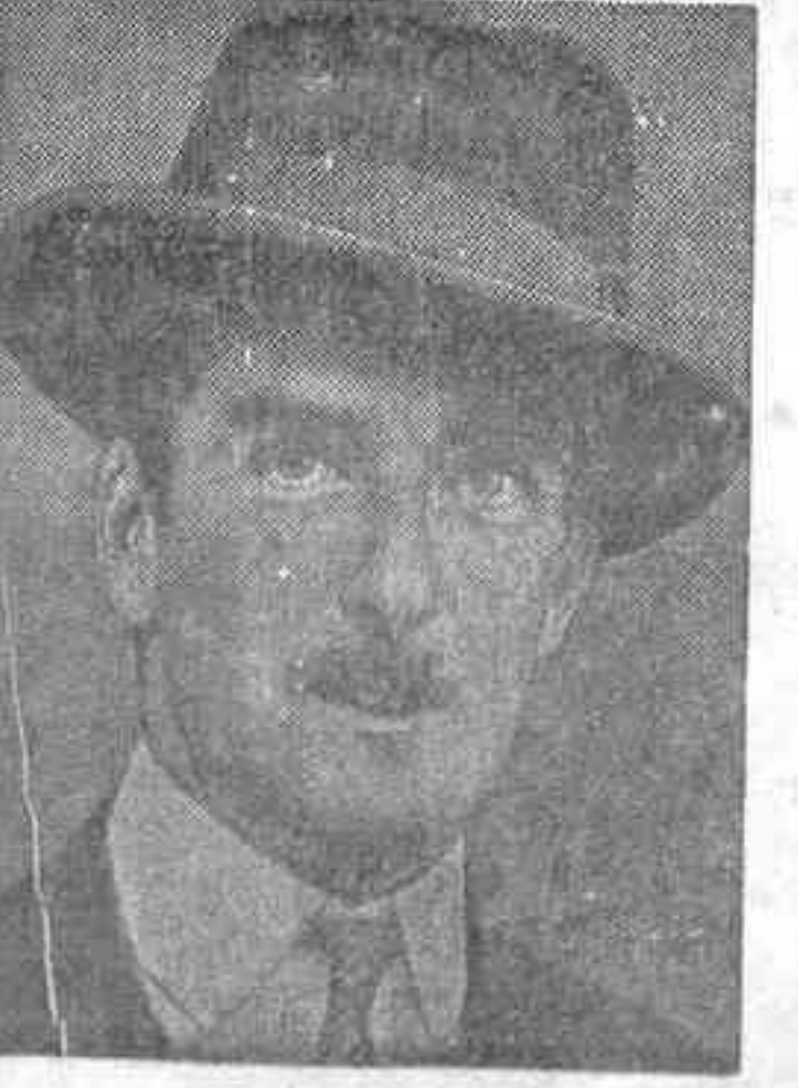
El ministro de Negocios Exteriores británico, Eden

LONDRES, 22.—Hoy, en la Cámara de los Comunes, el ministro del Exterior, Eden, dió cuenta de haberse recibido en el Foreign Office una comunicación del cabecilla Franco, manifestando que Francia realiza una labor contraria al pacto de Algeciras, en la zona del Protectorado de Marruecos, y pide que los signatarios de dicho pacto—firmado en 1912—envíen investigadores. Eden, al dar cuenta del asunto a la Cámara, manifestó que tal comunicado lo Franco no podía tomarse en consideración para adoptar medida de ninguna especie en el sentido que interesa. En todo caso, la cuestión debe ser zanjada directamente entre España y Francia. Incluso los diputados que ante de la tragedia que vive en otras ocasiones no se ocultan la nación española, acogieron la nota para exteriorizar su simpática y grotesca salida de Franco con ella por el traidor militar con gran frialdad.