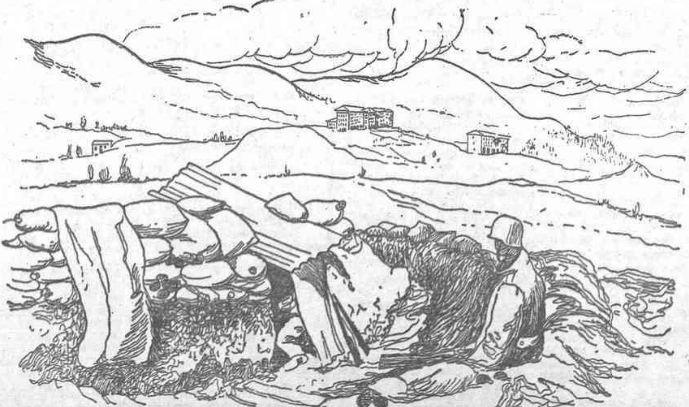
DE NUESTRAS TRINCHERAS DE RANDO.—A muy pocos pasos del Santuario del Naranco