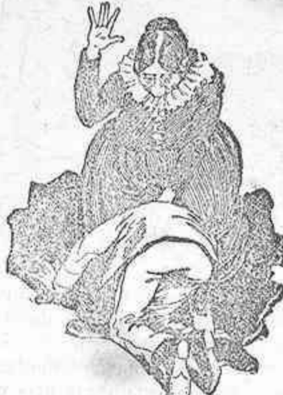
¡Aquella señora era doña Cayotana!

Yo, sorprendido por aquel ataque brusco, caí al suelo hecho una pelota.