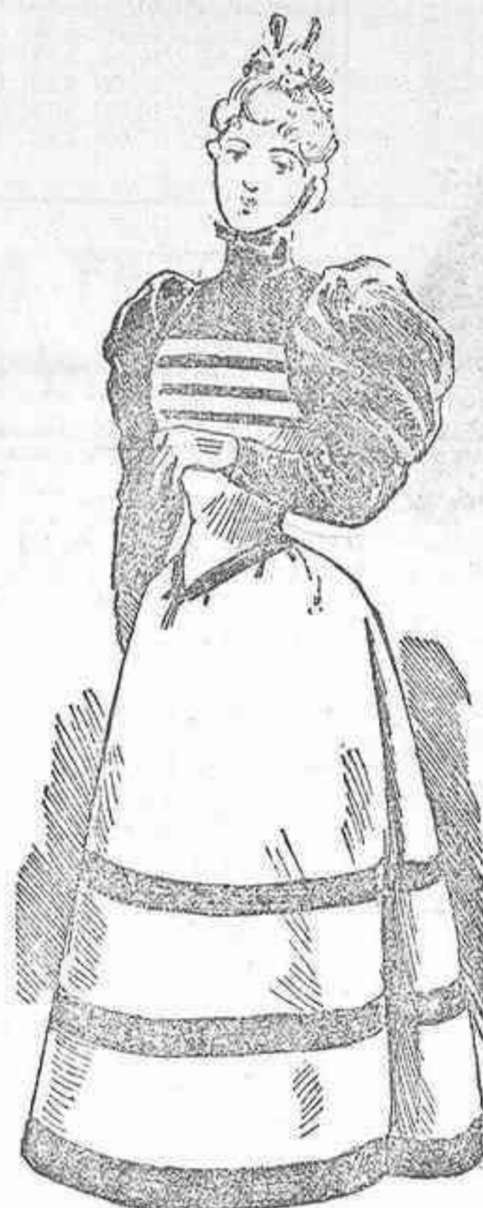
Traje de visita

Uno de los modelos de Madame Moslard que más aceptación han tenido por su elegancia y sencillez, es el conocido con el nombre de vestido Regente . El cuerpo de sural color heliotropo, hállase constituido por un peto suelto y un pequeño corselete adornado por una ancha cinta que forma lazo en el lado izquierdo. Las mangas forma globo, hállanse recubiertas por una hombrera de encaje bordado, hechura Recamier ; y la falda campana guarnécese en los bajos con un volante dentado y en los medios adórnase con un doble encaje bordado como el de las hombreras antes indicadas.