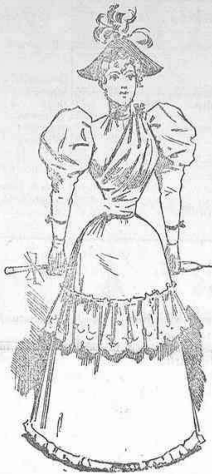
Traje de paseo

Traje de paseo.—Bata.—Vestido regente.—Traje de visita.