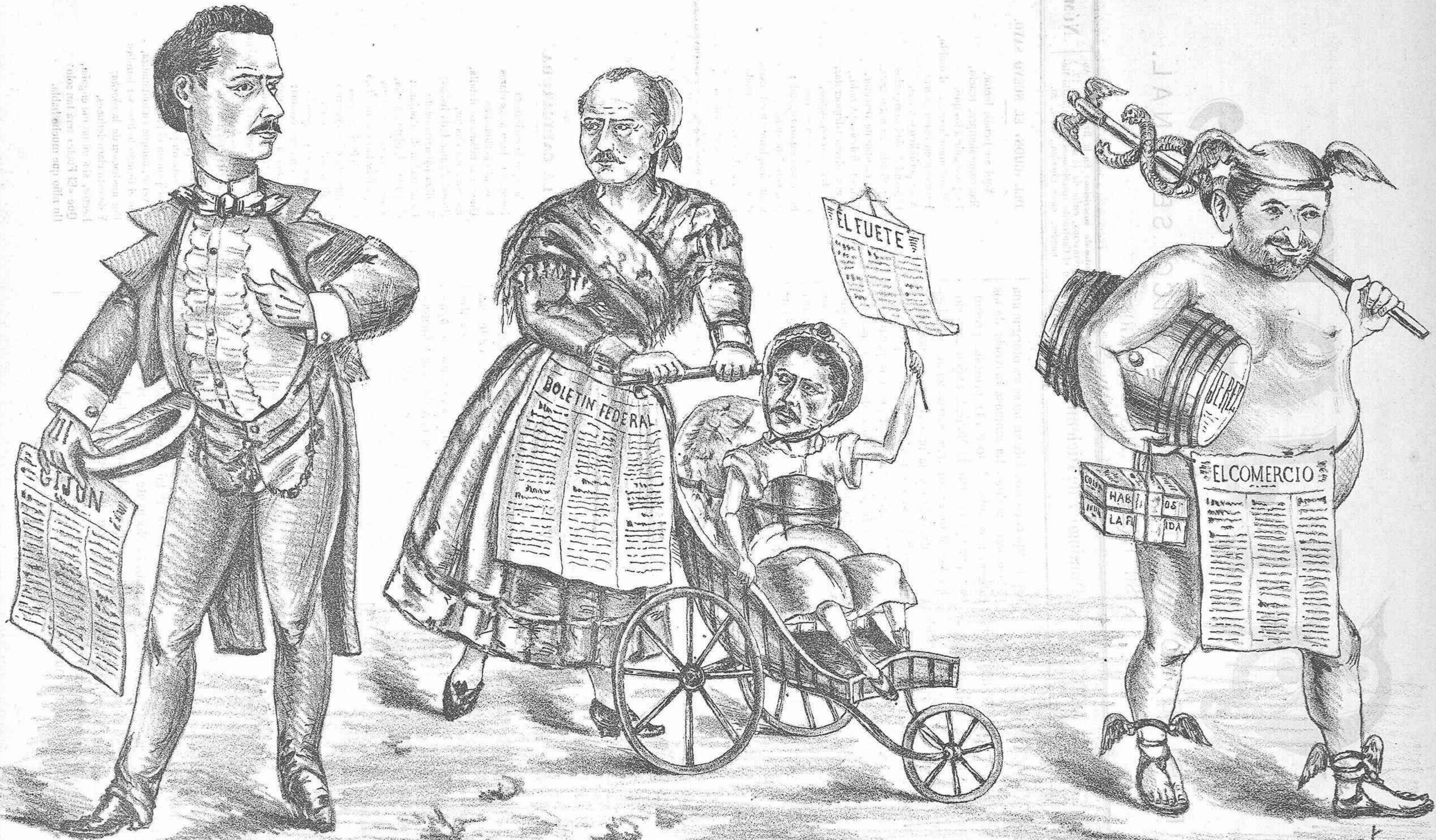
ESTADO ACTUAL DEL PERIODISMO EN GIJON.