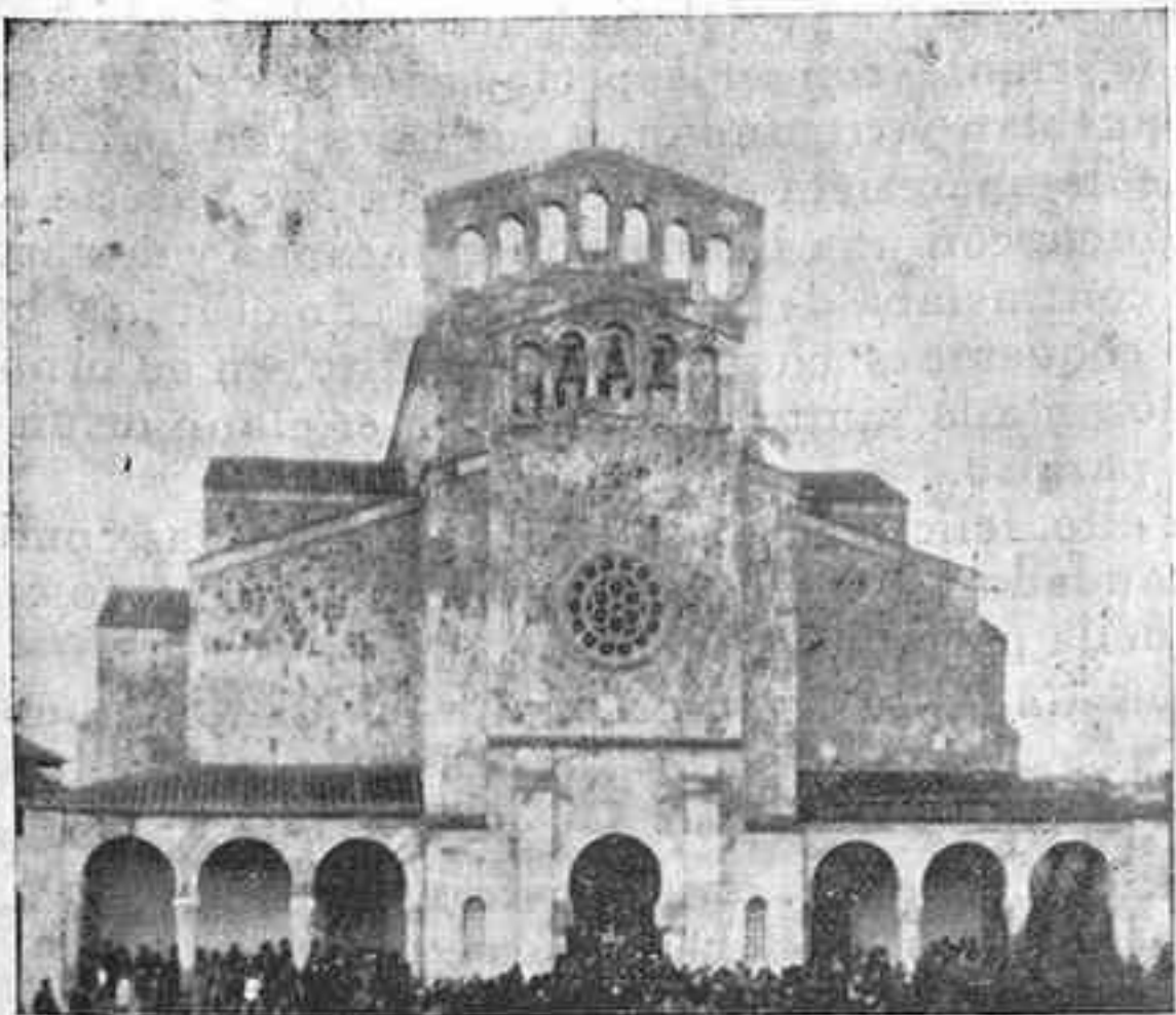
Soberbia iglesia, de puro estilo romano, bendecida por el Ilmo. Sr. Obispo de la Diócesis y abierta a los fieles en la vecina parroquia de Somio el pasado domingo, festividad de San José, y cuya construcción, costeada por suscripción entre aquellos vecinos, es objeto de grandes elogios.