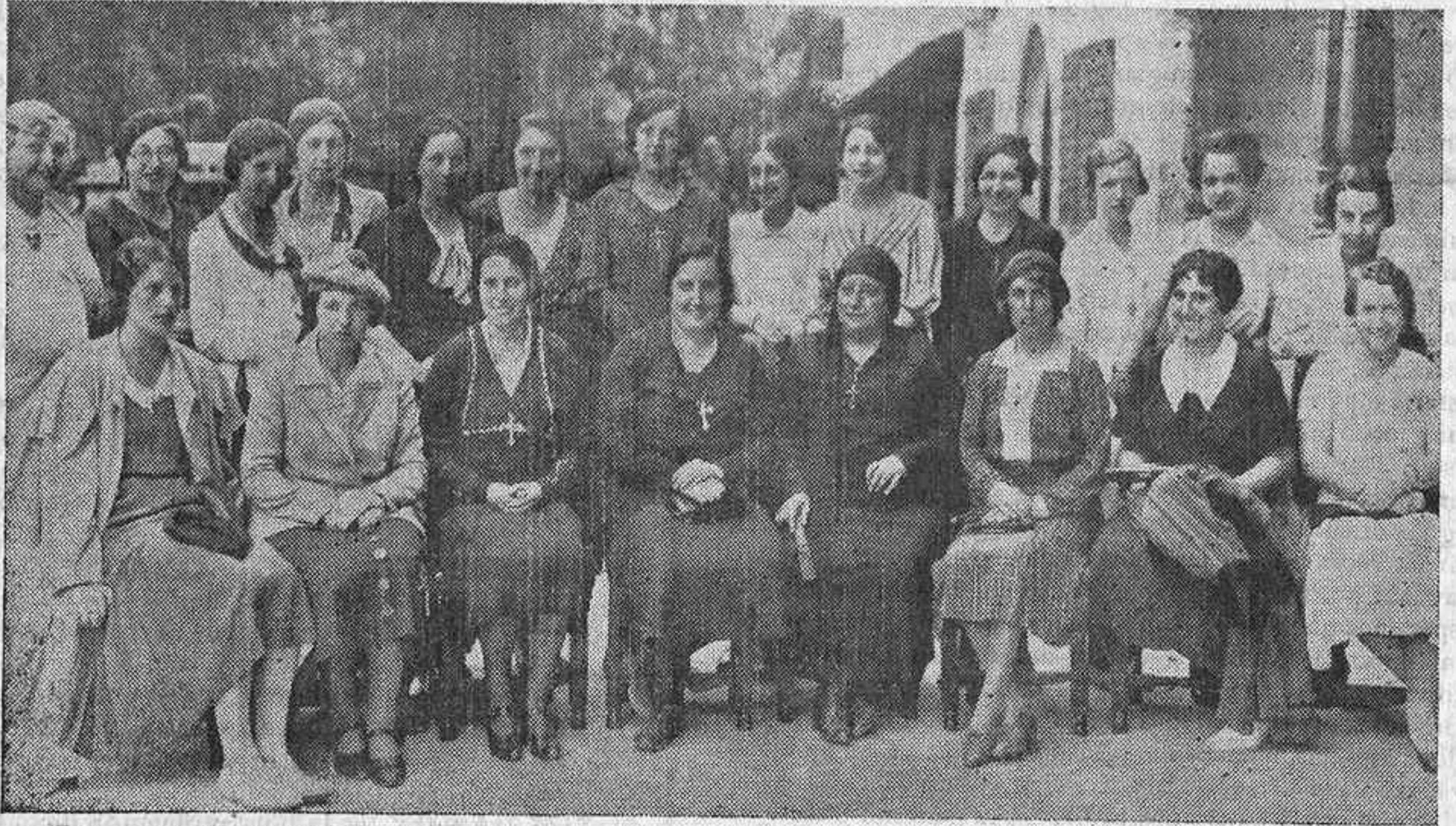
La Redacción y colaboradoras de «Acción», en la excursión a Covadonga

Es preciso sembrar para recoger. Es insensatez suicida no sembrar las buenas ideas, porque no se ve inmediatamente el fruto. Pablo Iglesias empezó la siembra del socialismo hace poco más de cincuenta años. Hoy sus discípulos recogen a manos llenas el fruto sembrado. ¿No aprenderemos nosotras, las católicas? Del enemigo el consejo.