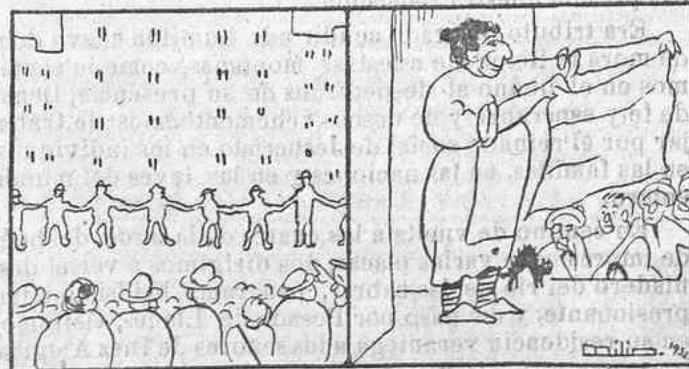
Los guardias, según su oficio, rodean el edificio.