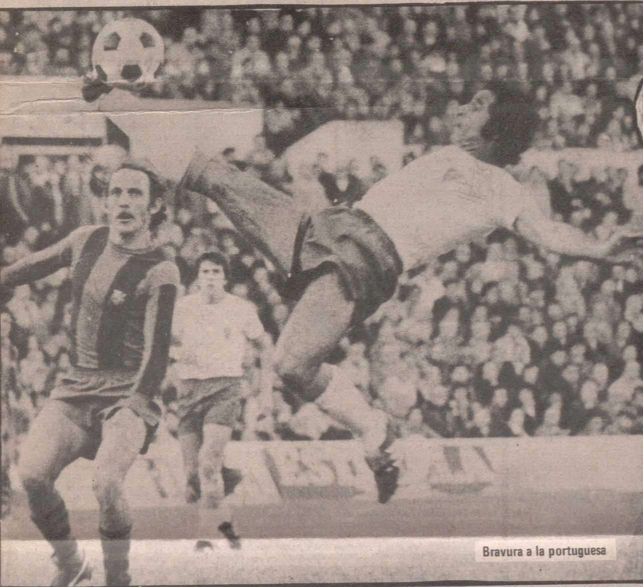
Bravura a la portuguesa