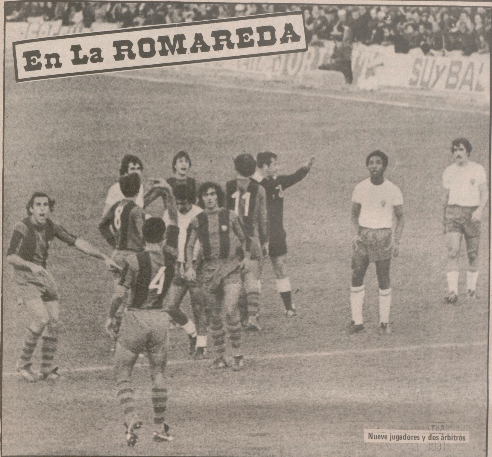
Nueve jugadores y dos árbitros

absoluto del... e se acentuó a... asaba el tiempo. El... llegó una vez al... o en el marcador... es, para mantener... endurecieron el... ando continuas... úblico. Al final el... uría una victoria... e trabajó mucho a... uento.