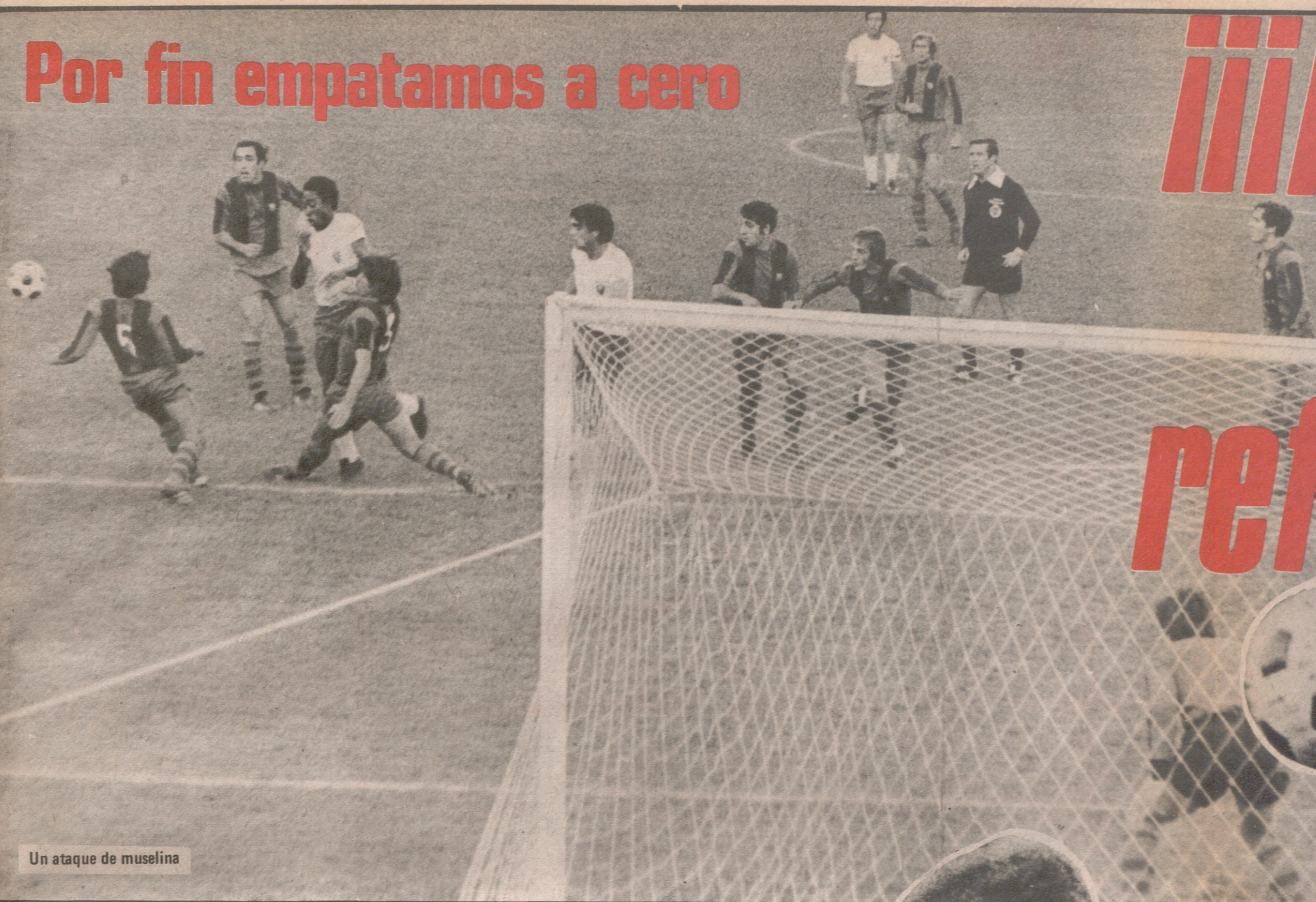
Un ataque de muselina