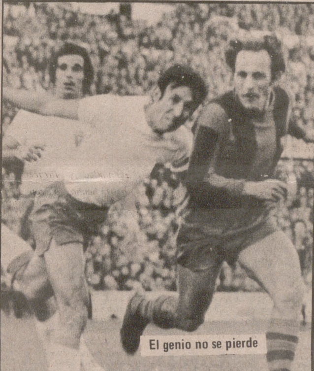
El genio no se pierde