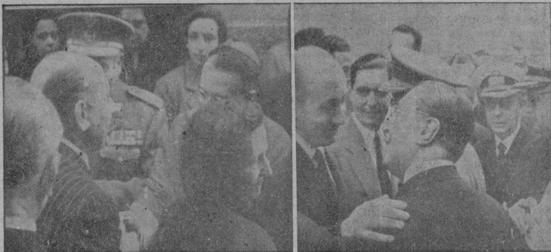
Familiares del señor Maura saludando a las autoridades durante el acto celebrado frente a la casa donde nació don Antonio Maura