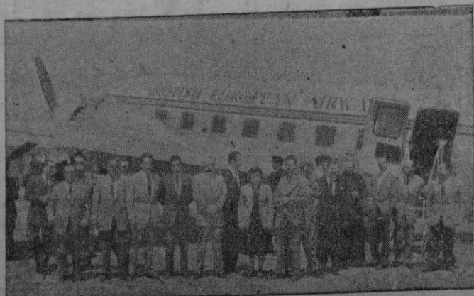
Grupo de invitados por la delegación local de la B.E.A. al vuelo que sobre la isla realizó el aparato que a partir del día 14 cubrirá la línea Londres-Palma